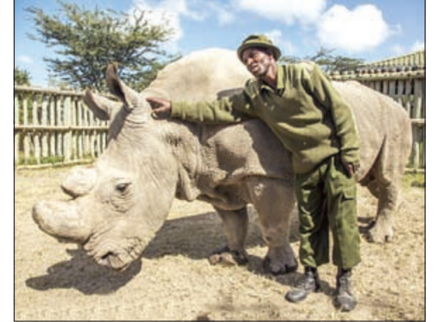
الحيوانات المتبقية تحظى بحراسة مشددة