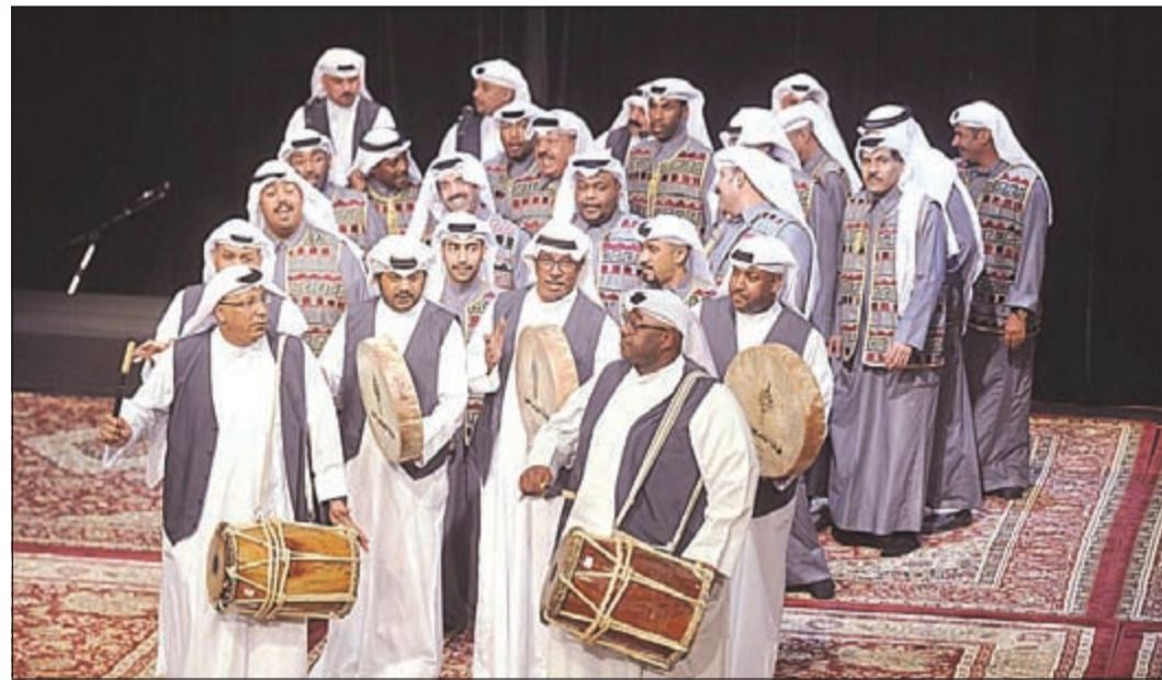
جانب من أنشطة فرقة التلفزيون