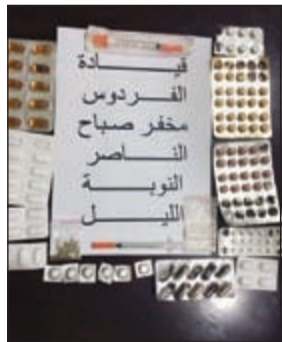
... والتي ضبطت في صباح الناصر