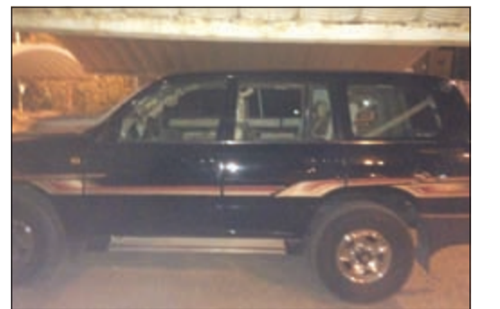
سيارة المدين الداعشي