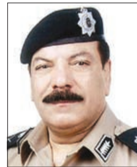
لواء عبدالفتاح العلي