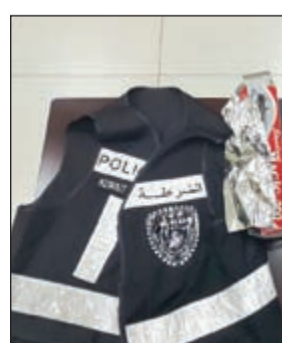
الستره العسكرية والمخدرات إلى «الجناينة»