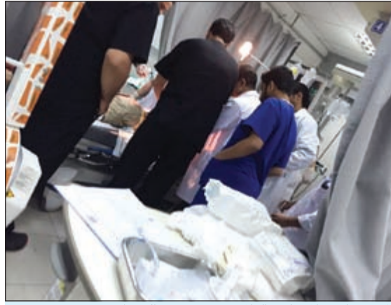
المجنى عليه خلال تلقيه العلاج في مستشفى الجهراء

احتجز رجال خفر السواحل 11 وافداً قيل إنهم