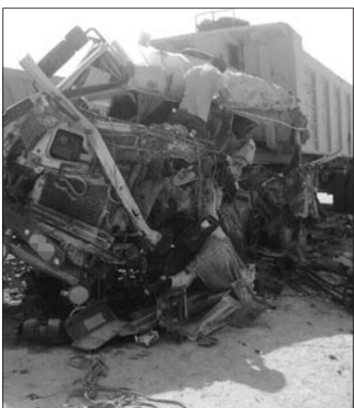
من حادث الصبية