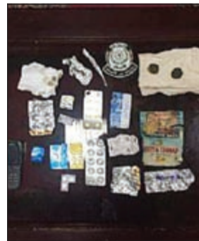
المخدرات المضبوطة مع الهنديين