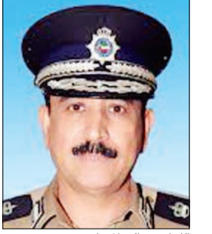
لواء عبدالله المهنا

قامت الإدارة العامة للمرور والتي يرأسها اللواء عبدالله المهنا بسلسلة من الحملات المفاجئة في المحافظات الست وذلك خلال الفترة من 19-2015/7/25 حيث أسفرت تلك الحملات عن تحرير (39622) مخالفة و حجز (2165) مركبة مطلوبة كما تم إيداع عدد (30) شخصاً إلى نظارة المرور لارتكابهم عدة مخالفات جسيمة. كما تم إبعاد (13) وافداً بسبب قيادتهم المركبة دون الحصول على رخصة سوق.