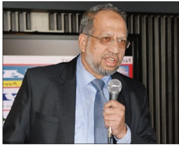
كل الدعم من الملاك