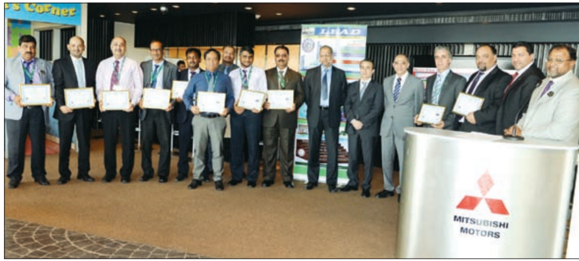
مجموعة الملاك كرمت المشاركين في المبادرة