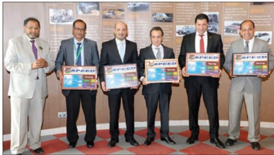
مشاركون بعد تسليمهم الشهادات

في أيامنا هذه وضمن بيئة تجارية تنافسية بدرجة عالية، ترتقي مجموعة الملا أن أحد العناصر الأساسية في نجاحها المستمر وريادتها في السوق هو اهتمامها بالبالغ بانشطة تطوير الموظفين وتعليمهم. تمنح المؤسسات أدوات فعالة ومسؤولية التنفيذيين تقوم على جذب المواهب الكفوة في السوق وعلى تطويرها بشكل مستمر وعلى تحفيز المواهب من خلال الانخراط على النحو المطلوب عن طريق وضع سبيل تعلم مختلفة وإتاحة فرص ضمن النظام نفسه. وفي المقابل، تسعى المؤسسات إلى الاحتفاظ بالقوى العاملة المختصة التي تشكل ضمانا لتحقيق الأهداف اللازمة القائمة على نيل رضا عملائها.