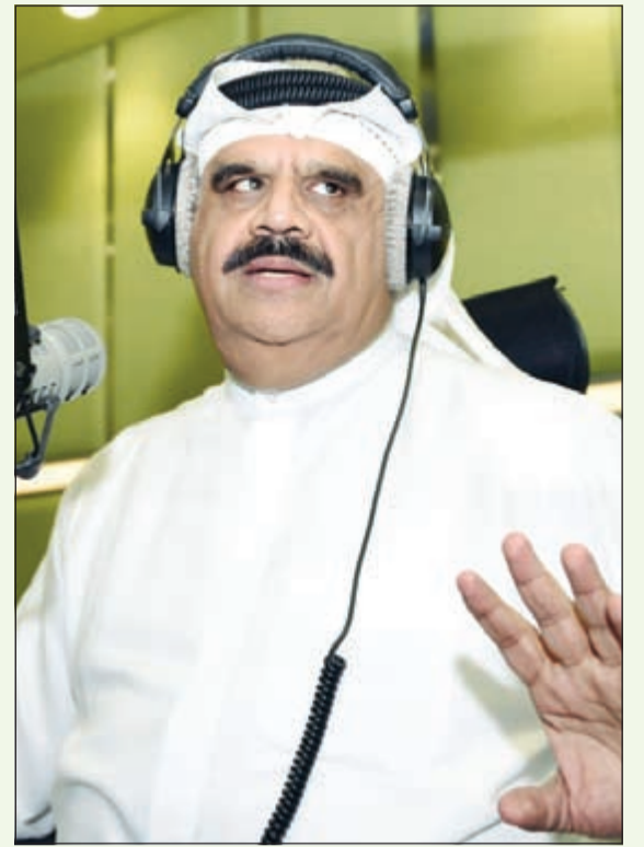
النجم داود حسين