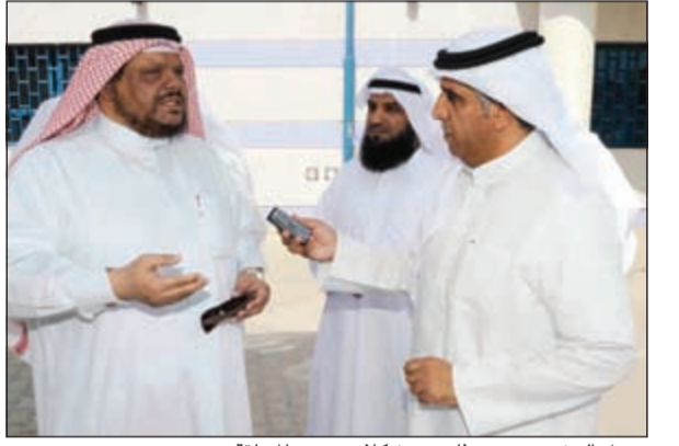
مزل الرشيدى متحدثا عن مشكلات بيوت المنطقة