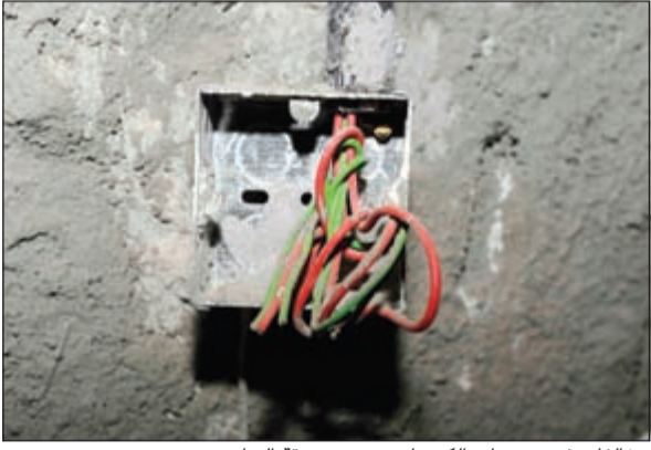
مخالفات في تمديدات الكهرباء تسمح بسرقة التيار