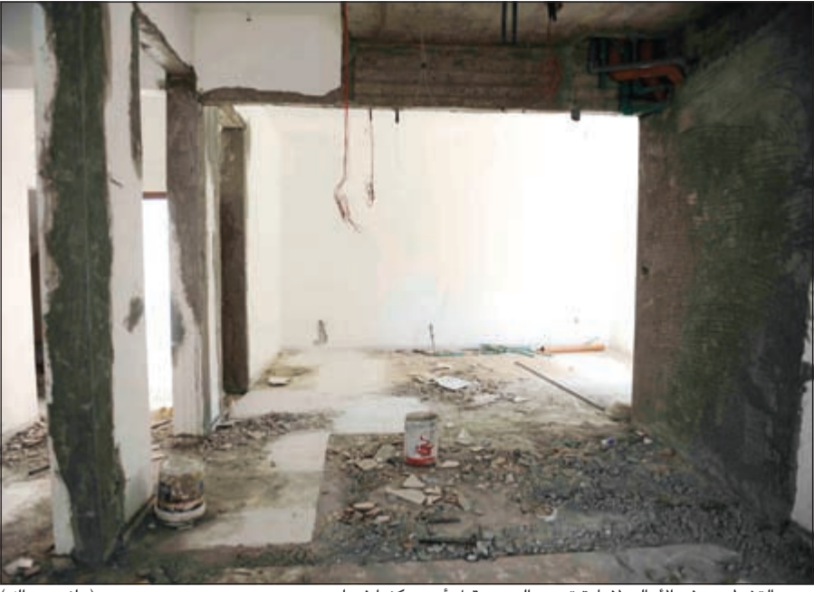
سواء التشطيب دفع الأهالي لإعادة ترميم البيوت قبل أن يسكنوا فيها (هاني عبدالله)