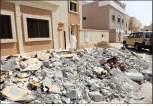
سكان المنطقة بدأوا بالهدم لاستكمال نواقص الإسكان على حسابهم

أكدوا سرقة مولدات الديزل التي يستخدمونها.. واشتكوا من غياب مهندسي «السكنية» عن متابعة الصيانة وإصلاح العيوب في البيوت الحكومية