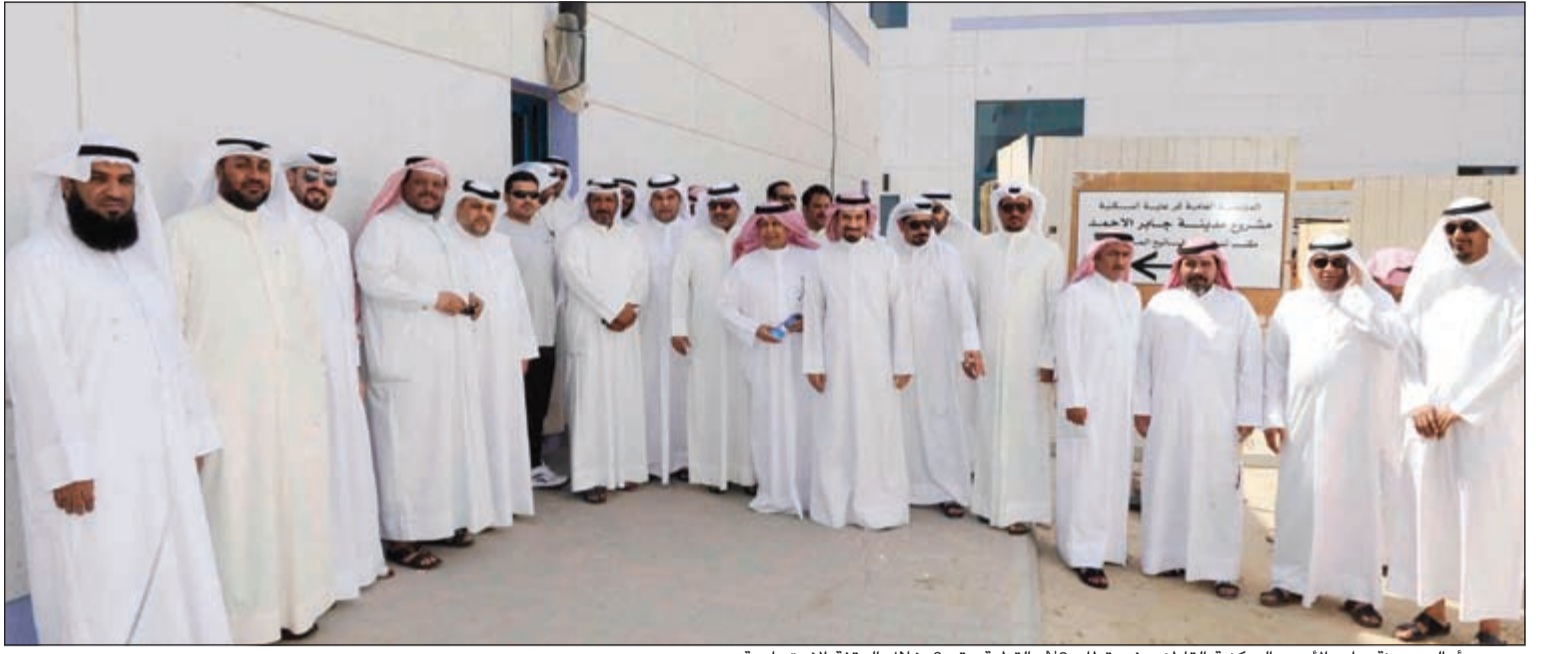
عدد من أهالي مدينة جابر الأحمد السكنية القاطنين في قطاع N2 بالقطعة رقم 6 خلال الوقفة الاحتجاجية