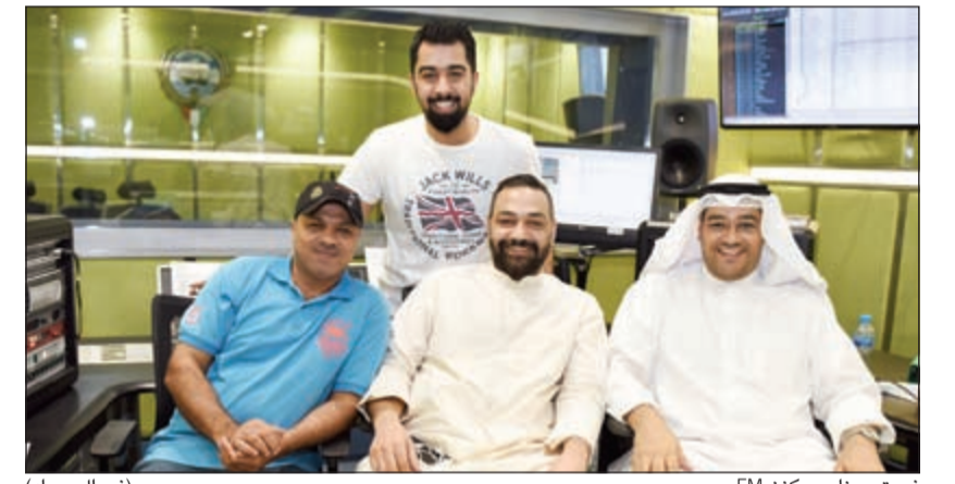
فريق برنامج «كنز FM»

المسابقاتي «كنز FM» الذي أقيم السبت الماضي تحت إشراف لجنة من الإعلان التجاري والشؤون المالية والإدارية بوزارة الإعلام، وذلك بعد أن تم فرز أرقام