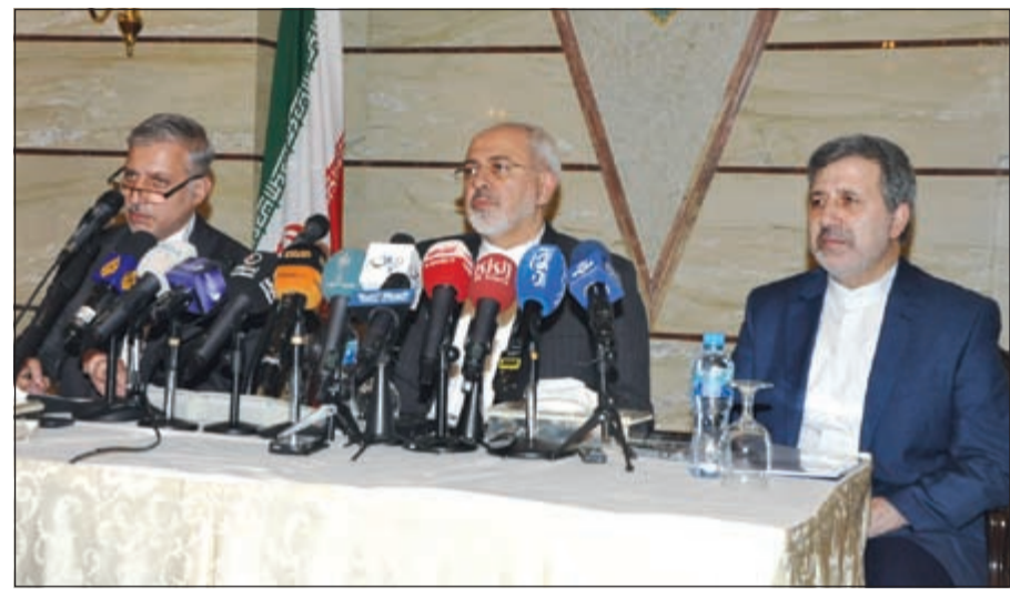
محمد جواد ظريف والسفير الإيراني خلال المؤتمر الصحفي (أحمد علي)

واضاف قائلاً: اعرف ان العديد من القضايا التي تطرح في هذا المجال هي ممتلئة بالمشاعر والاحاسيس لدى بعض الدول وايضا الساسة الغربيين، مشيراً الى ان بعض المسؤولين الغربيين اعلموا