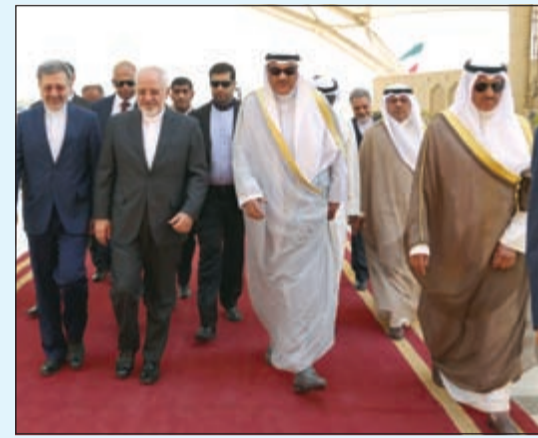
الشيخ صباح الخالد مستقبلاً وزير خارجية إيران محمد جواد ظريف

عقد رئيس مجلس الوزراء بالإتابة ووزير الخارجية الشيخ صباح الخالد جلسة مباحثات رسمية مع وزير خارجية إيران محمد جواد ظريف. وتناولت جلسة المباحثات التي عقدت في ديوان عام وزارة الخارجية بحث واستعراض كل القضايا محل الاهتمام المشترك والتطورات على المستويين الإقليمي والدولي بما فيها نتائج الاتفاق الذي توصلت إليه مجموعة «1+5» مع إيران بشأن برنامجها النووي ومناقشة أوجه العلاقات الثنائية الوثيقة بين البلدين.