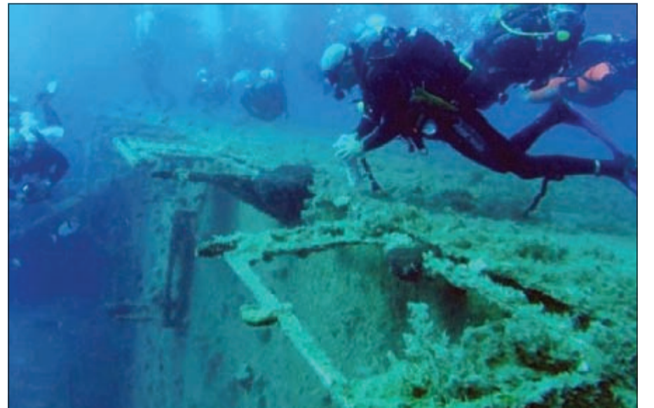
غواصون في موقع حطام سفينة زنوبيا

قبرص - أ.ف.ب: يرقد قبالة سواحل قبرص حطام سفينة زنوبيا الضخمة التي غرقت في أحدي ليالي الصيف قبل 35 عاما وقد تحولت هذه العبارة إلى نقطة جذب رئيسية للغواصين.