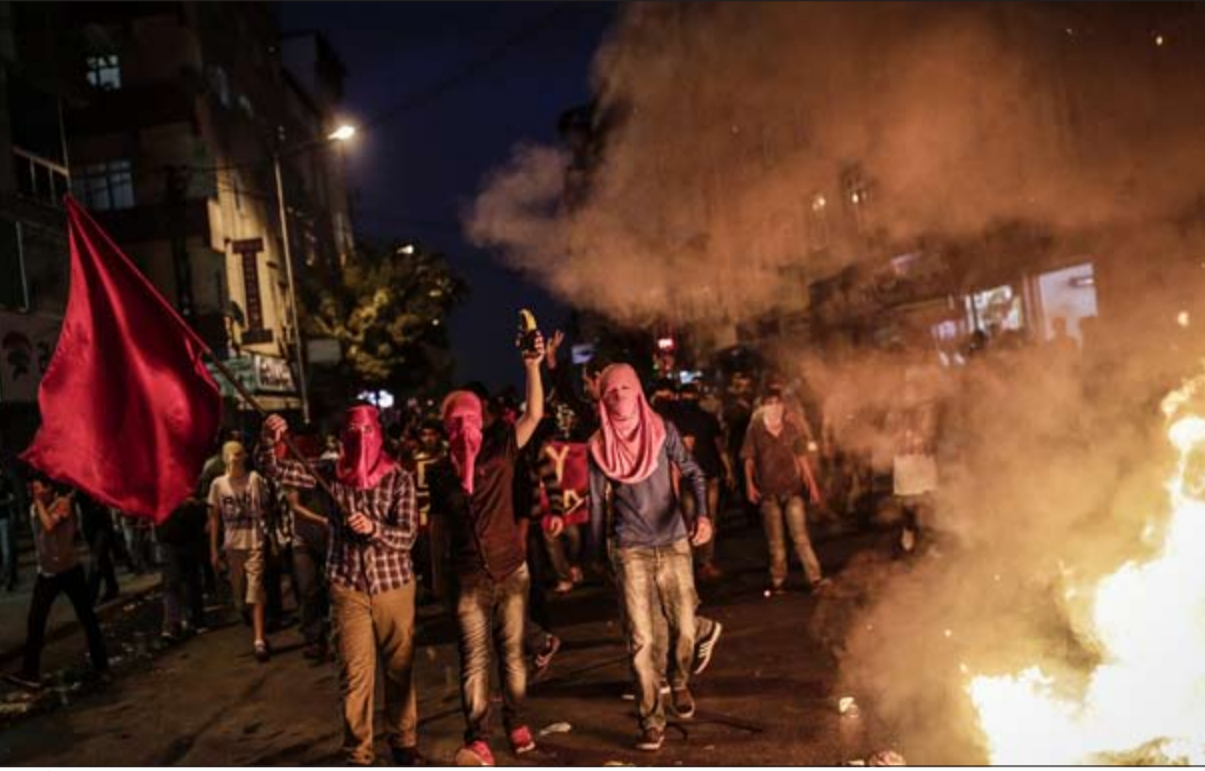
متظاهرون يساريون يحتجون على تحرك السلطات التركية ضد النشطاء الأكراد في اسطنبول