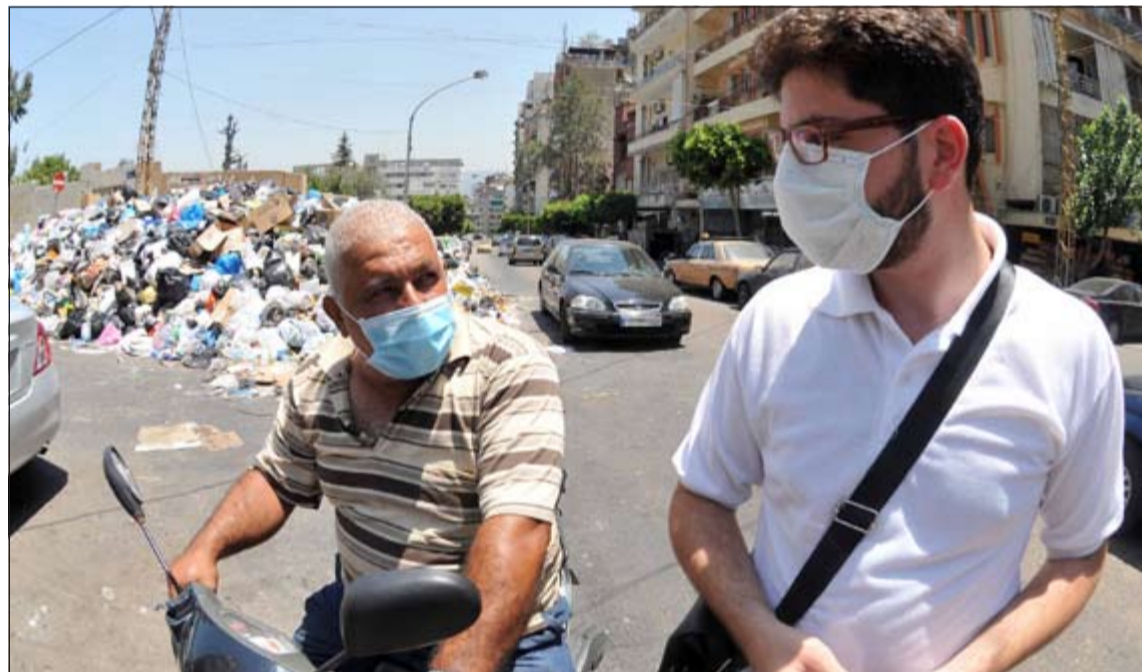
لبنانيون يرتدون كمامات لتفادي رائحة القمامة المكسبة بسبب أزمة النفقات (محمود الطويل)

عواصم - وكالات: أعلنت وكالة الأنباء الرسمية السورية (سانا) ان الرئيس بشار الأسد أصدر عفوا عاما عن جميع المنشقين من الجيش السوري المتخلفين عن الخدمة العسكرية، في حال تسليم أنفسهم ضمن مهلة محددة. وقالت الوكالة ان «المرسوم التشريعي رقم 32 لعام 2015، يقضي بمنح عفو عام عن جرائم الفرار الداخلي والخارجي والجرائم المنصوص عليها في قانون خدمة العلم المرتكبة قبل تاريخ أمس الموافق لـ 25 الجاري.