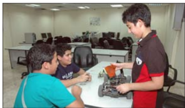
ورش النادي العلمي تستهجد تنمية الجانب العلمي لدى المشاركين