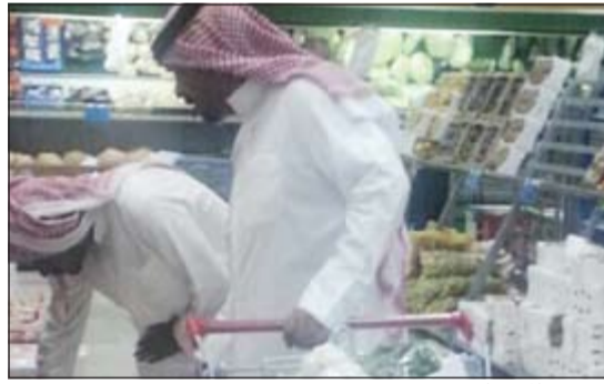
جانب من المهرجان