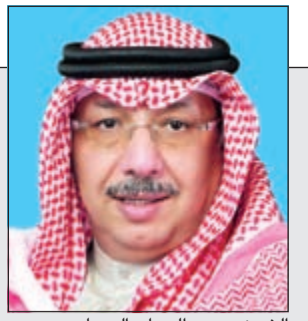
الشيخ محمد الجراح الصباح

BMW الفئة السابعة الجديدة كلياً ثورة في عالم الفخامة المعاصرة 30