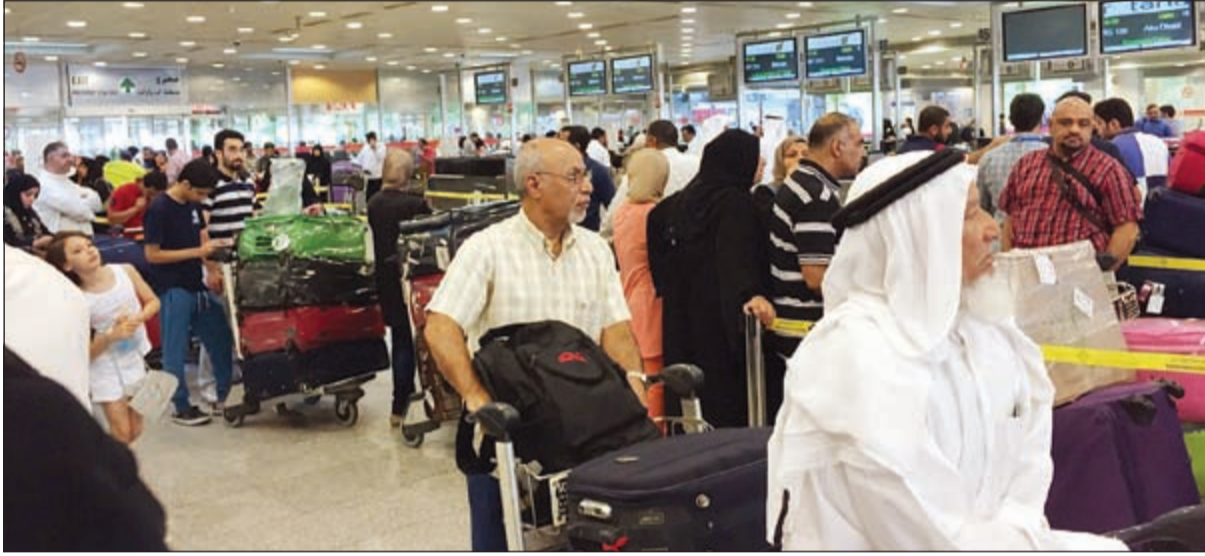
ازدحام كبير في صالة المسافرين بالمطار أمس

بتكلفة 40 مليون دينار لمواجهة ازدياد حركة المسافرين