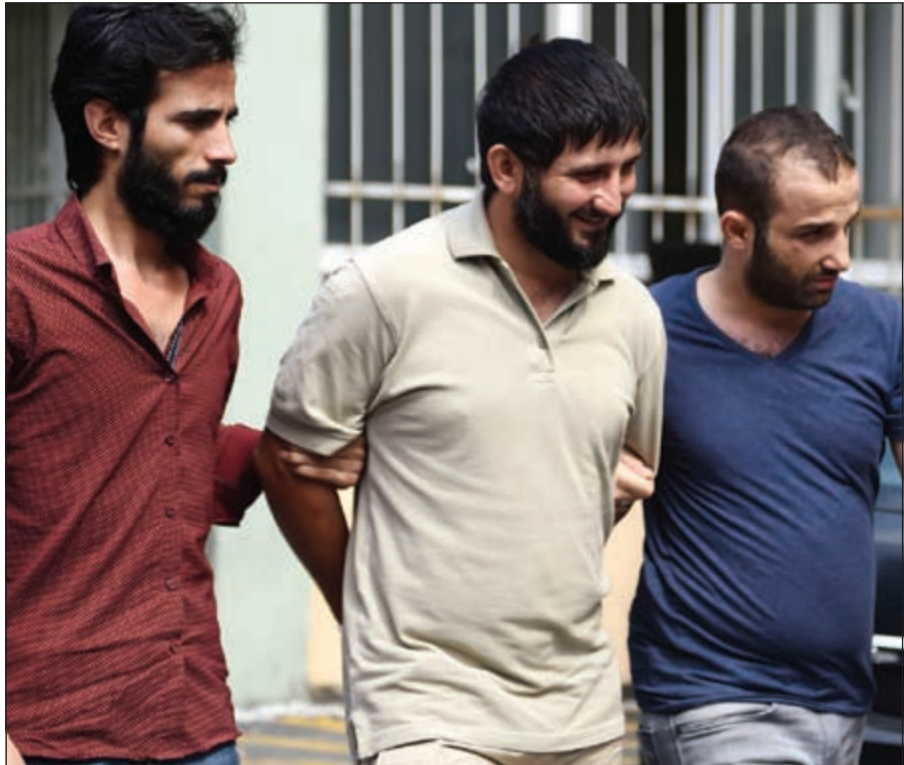
وعناصر شرطية أخرى خلال توقيفهم مشتبهها آخر في المدينة ذاتها أمس أيضا