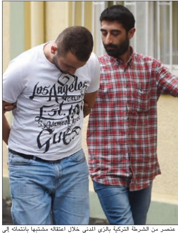
عنصر من الشرطة التركية بالزي المدني خلال اعتقاله مشتبهها بانتتمائه إلى «داعش» في إسطنبول أمس