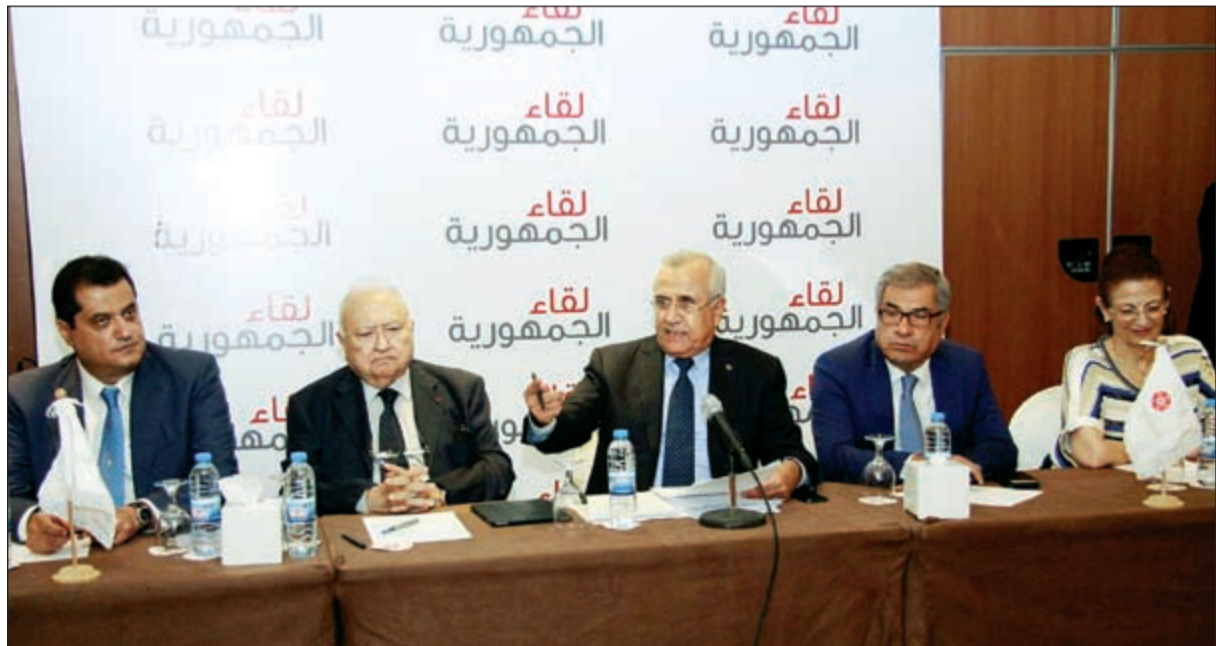
الرئيس العماد ميشال سليمان مترشحا للقاء الجمهورية، في فندق «تامار لانكستر» بالحازمية (محمود الطويل)

بتعطيل انتخاب رئيس الجمهورية ويدفع موقع قيادة الجيش الماروني إلى الفراغ، فأجاب: إذا لم يكن رئيس الجمهورية مبعيداً عن الكيدية بعيداً عن الكيدية، فانا لن ننتخبه، قد اخسر، وأنا اتحمل الخسارة، واتمم حملوها. وعن الاتفاق النووي الإيراني، قال انه يؤشر على بوادر حل، يبدأ بانتهاء داعش التي وجدت بقرار دولي لتنفيذ بعض المهامات، الآن انتهى دورها مع التكفيريين، اميركا تريد الانسحاب من أفغانستان ودول المنطقة، ستتحمل مسؤولياتها، وستستعمل اميركا وروسيا نفوذها لضبط حدود الدول المحيطة بسورية والعراق وتتم التصفية، مشيراً إلى نوع من التحالف المنطقي مع إيران، اميركا تريد إعادة ضبضية عسكراها في بلدها، وستتولى المحلقة هي التي ستتولى إنهاء المنظمات التكفيرية والإرهابية، وهذا يسمح ببناء دولة قوية في إيران، وأضاف: من الصين إلى باكستان وأفغانستان وإيران والعراق وسورية وخاصرتها لبنان، وسأل: أي دولة من هذه تقف على رجلها غير إيران؟ مؤكداً أنه خلال 35 عاماً صارت إيران دولة نووية صاعدة رغم الحصار الاقتصادي، وصارت بالفعل دولة عظمى إقليمية لها مداها الجغرافي.