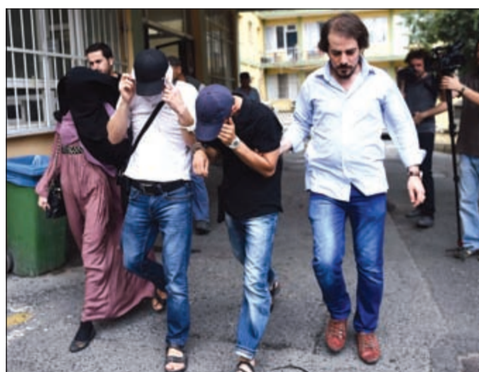
شرطة تركية بملاص مدينة تقوم باعتقال أفراد يشتبه في انتمائهم لتنظيم «داعش» أمس