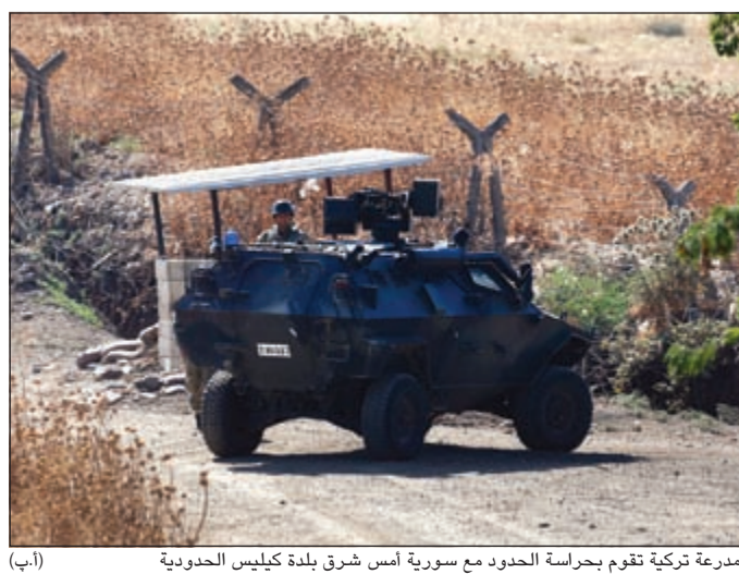
مدرعة تركية تقوم بحراسة الحدود مع سورية أمس شرق بلدة كيليس الحدودية

عواصم - وكالات: دخلت تركيا بقوة في الحملة العسكرية لمواجهة تنظيم الدولة الإسلامية (داعش) عبر شن أولى غاراتها الجوية على مواقع تابعة لهذا التنظيم داخل سورية أمس، فيما نفذت الشرطة حملة توقيفات لمكافحة الإرهاب في مختلف أنحاء البلاد لتعتقل أكثر من 297. وبحسب بيان للمنسقية العامة لرئاسة الوزراء التركية: «استهدف سلاح الجو التركي ثلاثة مواقع لتنظيم داعش داخل الأراضي السورية» بواسطة ثلاث طائرات من طراز أف 16، انطلقت من قاعدة القيادة الجوية الثامنة في ولاية ديار بكر». وذكرت المنسقية العامة للجو التركي ثلاثة مواقع لتنظيم داعش داخل الأراضي السورية. وأضاف الرئيس التركي رجب طيب أردوغان على الغارات التركية، قائلاً: إن الضربات لقواعد تنظيم الدولة الإسلامية في شمال سورية كانت «خطوة أولى»، مشيراً إلى أن الإجراءات ضد المتشددين الإسلاميين والأكراد واليساريين ستستمر. وعلى صعيد الاعتقالات، قال بيان صدر عن مكتب رئيس الوزراء أحمد داود أوغلو «تم توقيف عدد إجمالي بلغ 297 شخصاً لانتمائهم إلى جماعات إرهابية»، مضيفاً أن المدهامات جرت في 16 محافظة تركية.