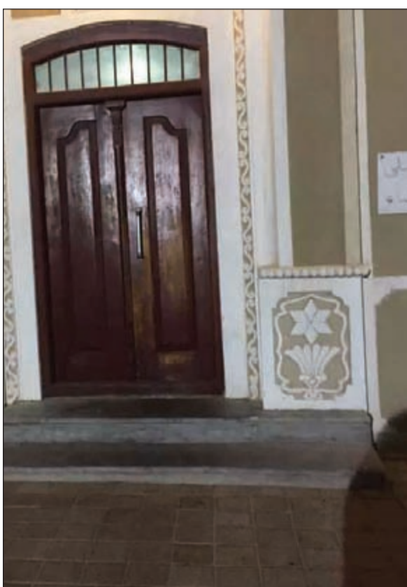
مصليات النساء أغلق أغلبها في صلاة الجمعة أمس

وقال د. الفلاح في تصريح خاص لـ «الأنباء»: إن ذلك سيكون من خلال لجنة مختصة بالتنسيق بين وزارتي الأوقاف والداخلية، مشيراً إلى أن اللجنة المختصة ستتولى جميع أمور هؤلاء المتطوعات، بداية من اختيارهن من بين نساء الحي الذي يقع فيه كل مسجد بعد اختبارات