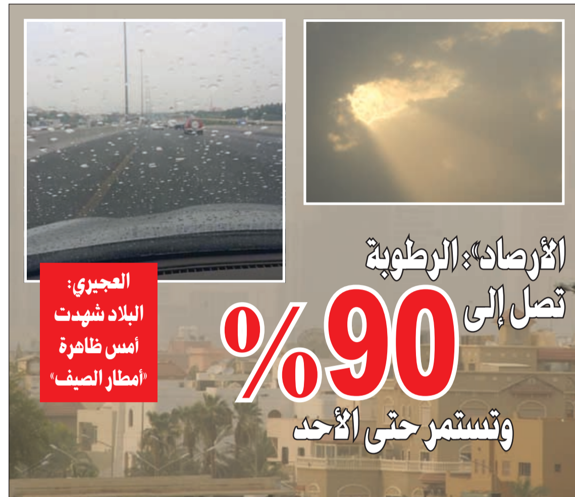
الرطوبة الكثيفة تخفي معالم العاصمة أمس وفي الأطار اليمين تكون غيوم صيفية في سماء البلاد، وإلى اليسار الدائري السادس بعد هطول أمطار خفيفة (هاني الشمري)