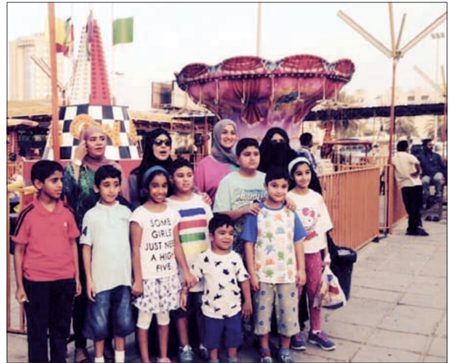
جانب من زيارة الأطفال إلى مقهى السالمية الشعبي

الشعبية التي تعبر عن امتداد لعادات وتقاليده المجتمع الكويتي وما جيل عليه الآباء والأجداد في أوقات فراغهم وتجمعهم في المقاهي الشعبية التي كانت تقدم لهم المكان المناسب للقاء بعضهم البعض والاستماع إلى أحوال الديرة ومساعدة المحتاجين من أهل الكويت والإطمئنان على أحوال الآخرين. ومقاهي اليوم هي من أهم الوسائل التي تمكن أجيالنا من معرفة احد الجوانب الاجتماعية والتمتع بالصورة المقاربة التي تعكس المجتمع الكويتي. وأشارت إلى أن هذا التعاون المتبادل بين مجلس إدارة المقاهي وإدارة المرأة والطفولة يأتي من خلال العديد من الجهود التنسيقية التي سبقت تنفيذ هذه البرامج حيث سبق أن قدمت المقاهي نموذجاً رائعاً للتعاون المشترك.