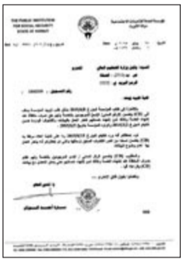
كتاب «التأمينات» لوزارة التعليم العالي

تكملي من رواتبهم الشهرية، وذلك حتى يتسنى لهم أخذ الراتب كاملاً بعد التقاعد دون انقاص، موضحين أنهم عندما قاموا بإصدار شهادة راتب مؤخرًا اكتشفوا أنه يتم أخذ الاستقطاع التكملي وأيضاً التأمينات الاجتماعية الخاصة بالمعاشات وهذا الأمر غير جائز قانونياً. وأفادت المصادر بأن أعضاء هيئة التدريس قاموا بمخاطبة وزارة التعليم العالي ممثلة بوكيل وزارة