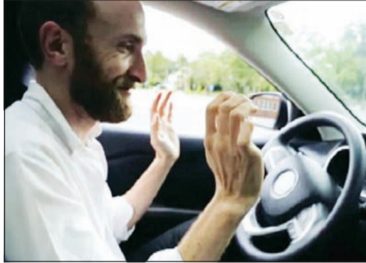
غرينبرغ يرفع يديه عن المقود الذي أصبح يحركه المخترقون