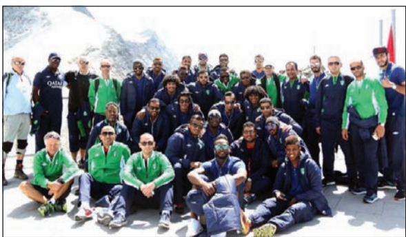
الأهلي تدرّب رغم تساقط الثلوج