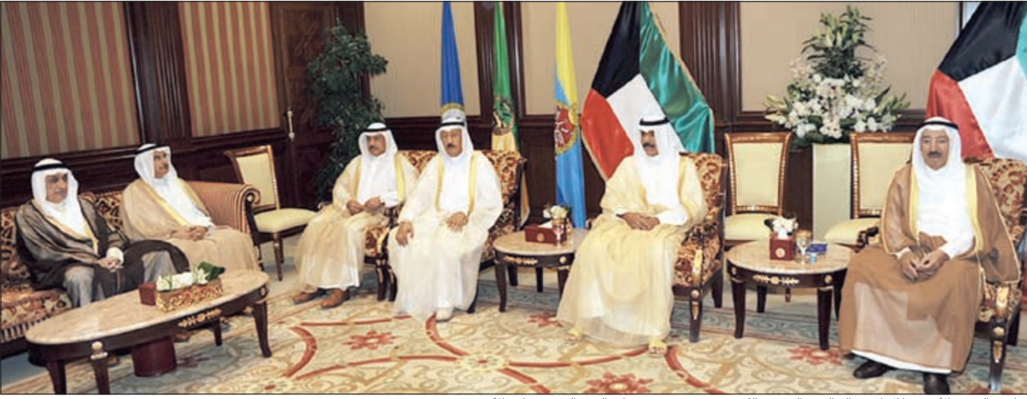
صاحب السمو الأمير خلال استقباله الوفد الشعبي الكويتي بحضور سمو ولي العهد الشيخ نواف الأحمد