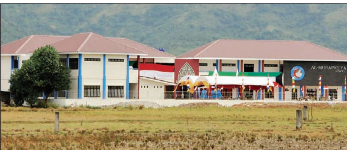
مشروع مدرسة المباركية الحرفية في إندونيسيا

وتوجيهات صاحب السمو الأمير الشيخ صباح الأحمد وحظيت بالكثير من الدعم والاهتمام من جمعية الهلال الأحمر الكويتية ووسط متابعة واهتمام كبير لتطورات الوضع الإنساني في إندونيسيا بشكل مكثف ومستمر. وأكد أن الجهود الإنسانية والإغاثية التي قدمتها الكويت لمساعدة إندونيسيا جراء الكوارث الطبيعية عكست بصورة مشرفة مساندة الكويت بقيادة وحكومة وشعباً لأشقائهم الإندونيسيين.