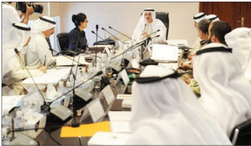
الشيخ سلمان الحمود أثناء ترؤسه الاجتماع الرابع للجنة الدائمة للاحتفال بالأيام والمناسبات الوطنية بحضور الشيخة أمثال الأحمد

بالأعياد والمناسبات الوطنية كي تأتي متنسقة مع المتطلبات الجماهيرية ومتابعة ردود فعل الجماهير حول أداء الحملة التسويقية للاحتفالات والعمل الحالي للفريق التنفيذي بالتعاون مع وزارة الدولة لشؤون الشباب والهيئة العامة للشباب والرياضة والمجلس الوطني للثقافة والفنون والآداب للوصول بالاحتفالات الوطنية إلى أقصى حد من الرضا الجماهيري وبما يرسخ رسالة الكويت الحضارية والإنسانية والثقافية.