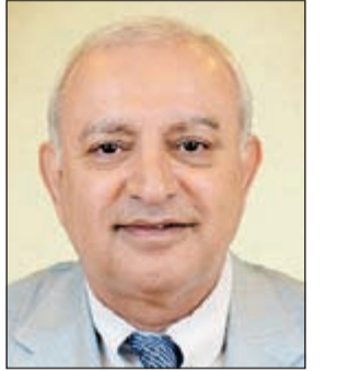
د. بدر العيسى

كشف وزير التربية ووزير التعليم العالي الدكتور بدر العيسى عن أن الانتقال إلى المبنى الجديد لوزارة التربية سيكون نهاية لوزارة الحالي، متوقفاً أن الانتقال سيكون في فبراير من العام المقبل، مشيراً إلى أن الطاقة الاستيعابية للمبنى ستضم الوزارة مع باقيها، كاشفاً عن احتمال دمج بين وزارة التربية والتعليم العالي بالمبنى الجديد. وفيما يخص ملف الشهادات الوهمية، وعما إذا كانت قد تلقت وزارة التربية والتعليم