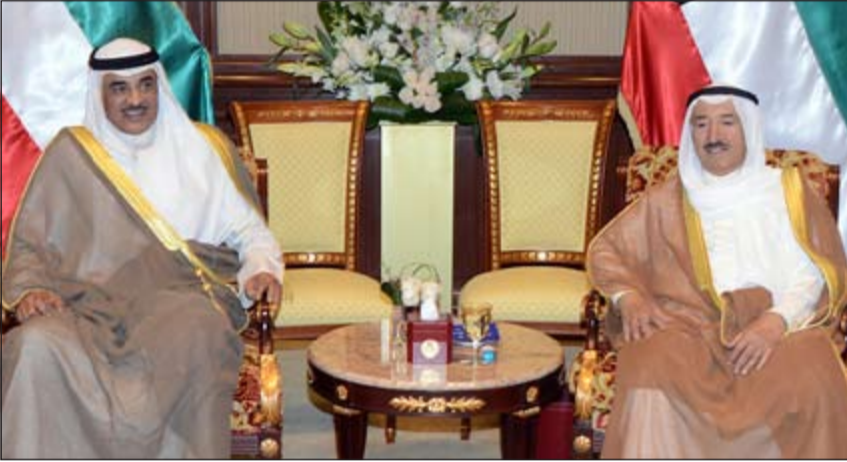
صاحب السمو الأمير الشيخ صباح الأحمد مستقبلاً الشيخ صباح الخالد

استقبل صاحب السمو الأمير الشيخ صباح الأحمد بقصر بيان صباح أمس سمو ولي العهد الشيخ نواف الأحمد، كما استقبل سموه بقصر بيان صباح أمس رئيس مجلس الوزراء بالإنابة ووزير الخارجية الشيخ صباح الخالد، كما استقبل صاحب السمو الأمير الشيخ صباح الأحمد بقصر بيان صباح أمس وبحضور سمو ولي العهد الشيخ نواف الأحمد استقبل سموه أعضاء الوفد الشعبي الكويتي الذي قام بزيارة إلى سماحة المرجع الأعلى السيد علي السيستاني وفضيلة الإمام الأكبر د. أحمد الطيب شيخ الأزهر.