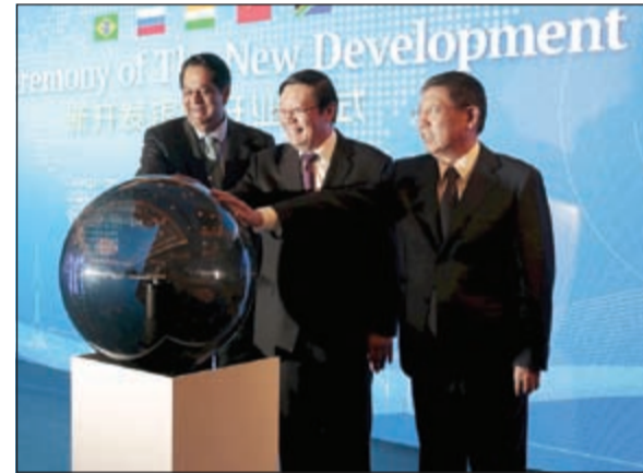
حفل افتتاح بنك التنمية الجديد التابع لمجموعة بريكس

تمثل 40٪ من سكان العالم، قررت في 2013 تأسيس هذه المؤسسة المالية الجديدة، وتزويدها برأسمال يقدر بـ 100 مليار دولار.