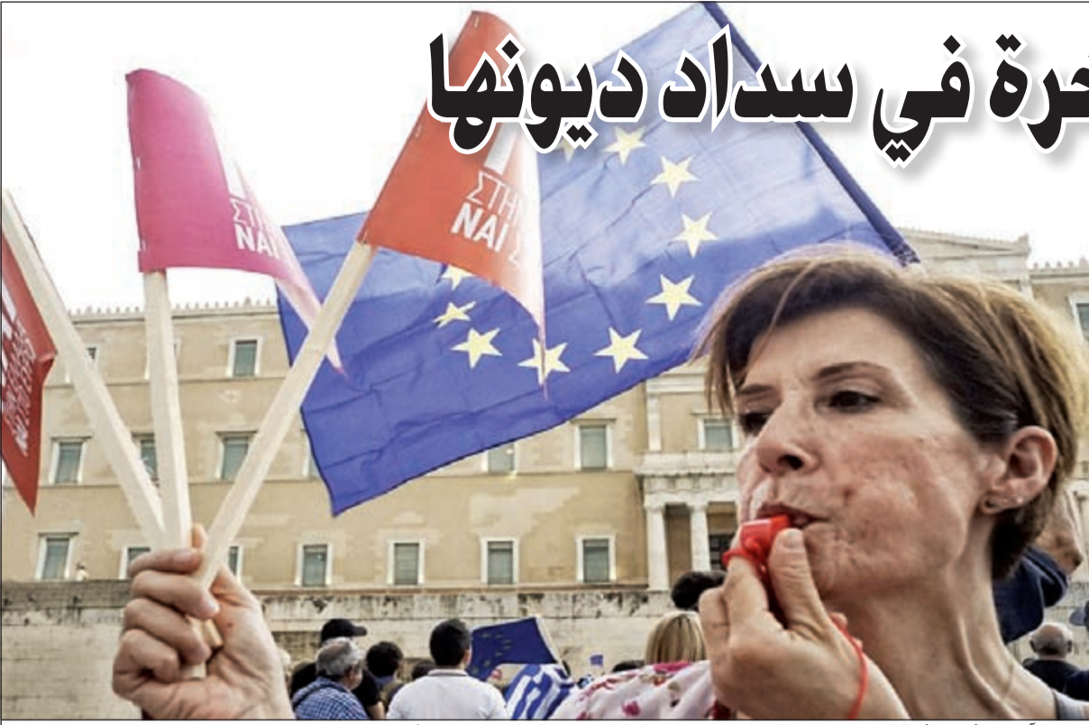
تجدد الآمال بشأن حل أزمة الديون بعد دفع اليونان مستحقات عليها للصندوق الدولي والمركزي الأوروبي

عواصم - وكالات: قال صندوق النقد الدولي، أمس الأول اليونان ردت إلى الصندوق متأخرة مستحقة عليها قيمتها نحو مليار يورو.