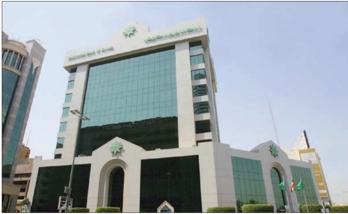
تسويات «التجاري» ساهمت في نمو أرباح البنك بالربع الثاني من 2015

وكان البنك قد حقق أرباحاً صافية قدرها 16,7 مليون دينار بالنصف الاول من 2015 وبزيادة قدرها 26% مقارنة بالنصف الاول من