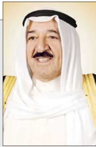
صاحب السمو الأمير الشيخ صباح الأحمد