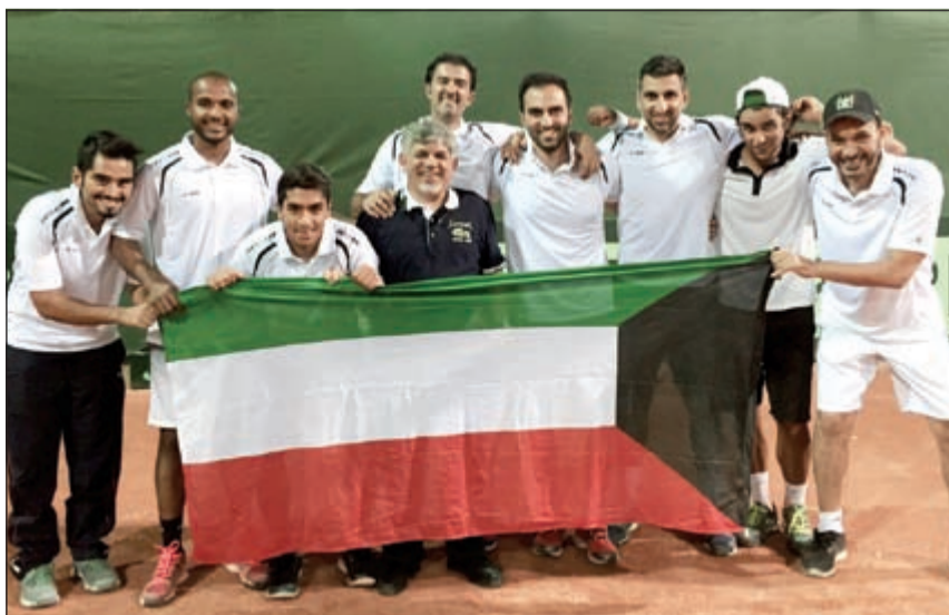
أبطال التنس يحملون علم الكويت

أيام التصفيات. كما أهدى هذا الفوز إلى سمو الأمير الشيخ صباح الأحمد وسمو ولي عهده الأمين الشيخ نواف الأحمد وإلى مدير الهيئة العامة للشباب والرياضة الشيخ أحمد المنصور وإلى رئيس اللجنة الأولمبية الشيخ د. طلال الفهد الصباح ورئيس اتحاد التنس الشيخ أحمد الجابر لمناقبته المتواصل للمنتخب في طهران.