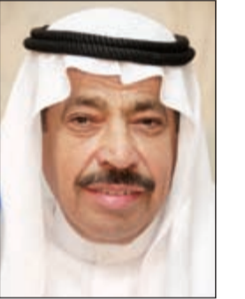
د. عبدالعزيز البابطين

حددت مؤسسة عبدالعزيز سعود البابطين الثقافية يوم 24 أكتوبر المقبل موعداً لإطلاق دورتها الخامسة عشرة والتي ستقيمها ببريطانيا بالتعاون مع جامعة أكسفورد، مركز الشرق الأوسط، في لندن. وقال رئيس المؤسسة الشاعر عبدالعزيز سعود البابطين أن هذه الدورة تأتي ضمن سعي المؤسسة لعقد دورات خاصة بحوار الحضارات إلى جانب دوراتها الأدبية، وذلك انسجاماً مع المستجدات العالمية التي توجب الصراعات في مختلف الدول وتذهب ضحيتها الشعوب.