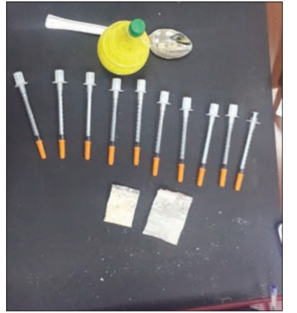
الحقن التي سلمها الأب لرجال الأمن العام

بعد ضبطه صادمة حينما تقدم مواطن مسن باكيا لبسلم رجال الأمن 10 إبر بها مواد مخدرة، مؤكدا أنها تخص ابنه الذي حاول بشتى الطرق منعه عن الإدمان دون جدوى، طالبا رجال الأمن باتخاذ ما يلزم نحو إبعاد ابنه عن طريق اللاعودة، وبحسب مصدر أمني فإن الشاب الكويتي ضبط في محافظة حولي، حيث كان