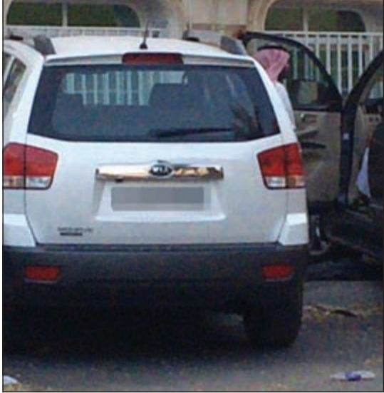
السيارة التي ابلغ الحدث عن أنها مفخخة

استنفرت أجهزة وزارة الداخلية ممثلة في إدارة المتفجرات والأمن العام إثر بلاغين عن سيارتين مفخختين وردا إلى عمليات الداخلية أمس الأول، وقال مصدر أمني إن حدثا ابلغ عمليات الداخلية عن تلقيه اتصالا من هاتف لا يعرفه يفيد بأن سيارة عمه مفخخة وطلب منه نقل السيارة إلى مسجد قريب من محل سكنه في الظهر ويدين كذب البلاغ وتم اختصار جهاز أمن الدولة، وفي الجهرء ابلغ مواطن من مواليد 1991 ويعمل في وزارة الدفاع عمليات الداخلية بأنه تلقى اتصالا على هاتفه يفيد بأن سيارته مفخخة ولدى انتقال رجال الأمن