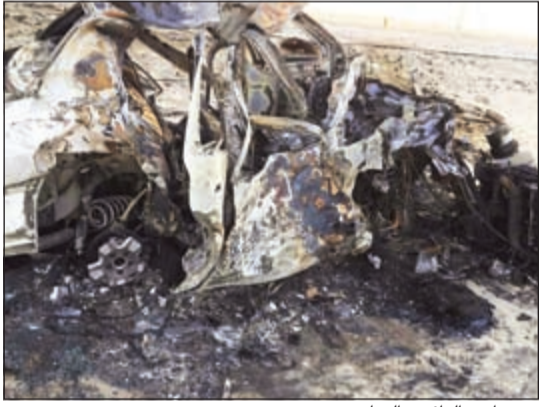
من حادث الدائري السابع

شهدت طرق الكويت ثاني أيام عيد الفطر السعيد عدة حوادث مرورية موسعة أودت بحياة 5 أشخاص على الأقل، وبحسب مصدر أمني فإن بلاغا ورد إلى عمليات الداخلية عن تصادم ثنائي في منطقة المهبولة، وبانتقال رجال الأمن تبين أن الحادث اودى بحياة شخص وتم نقل مرافقه إلى مستشفى العبدان، ولكنه وصل إلى المستشفى متوفي، لتسجل قضية حادث ووفاة. وإلى منطقة الاحمدى وتحديدا قبل جسر الاحمدى حيث أدى انقلاب مركبة رباعية الدفع إلى وفاة قائدها وهو كويتي، كما توفي مواطن (21 عاما) على طريق