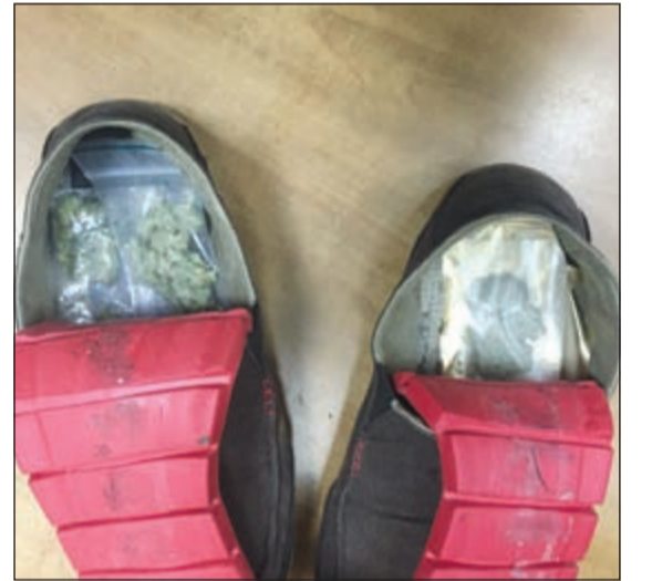
البريطاني لغم حذائه بالماريغوانا