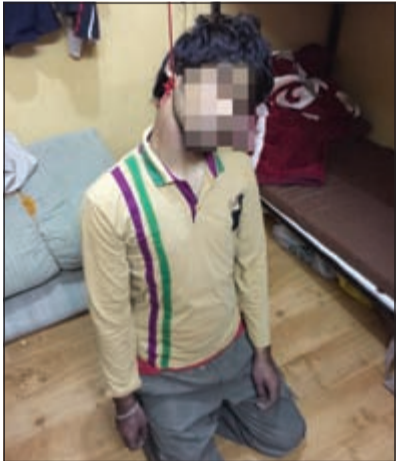
.. والانتحار بجبل في الأحمدى