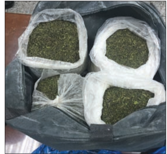
القات أخفي داخل شنط «مهند باج»

أحال مراقب مطار الكويت الدولي سليمان الفهد أمس إلى الإدارة العامة لمكافحة المخدرات وأفدتين من الجنسية الإثيوبية تعملان خادمتين في منزل مواطنين، إلى جانب مهندس بريطاني بعد محاولات فاشلة لإدخال مخدرات إلى الكويت ظنا منهم أن العطلة ستسهل دخول هذه المواد المخدرة.