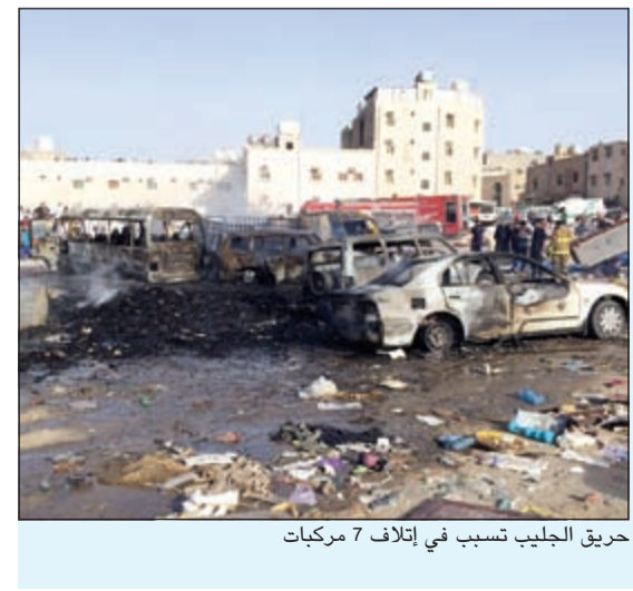
حريق الجليب تسبب في إتلاف 7 مركبات

تسبب حريق نشب في مهملات في منطقة جليب الشيوخ يوم أول من أمس في إتلاف 7 سيارات كانت على مقربة من الحريق الذي اندلع داخل ساحة تراسية، ويرجح أن يكون الحريق بسبب عقب سيجارة ألقتها مجهول على مقربة من المهملات، هذا وانتقل رجال الأدلة الجنائية لرفع الأنار، وتعامل مع الحريق رجال إطفاء العارضية والجلب، واستمر التعامل مع الحريق أكثر من ساعة، وقد خلف الحريق سحبا دخانية كثيفة.