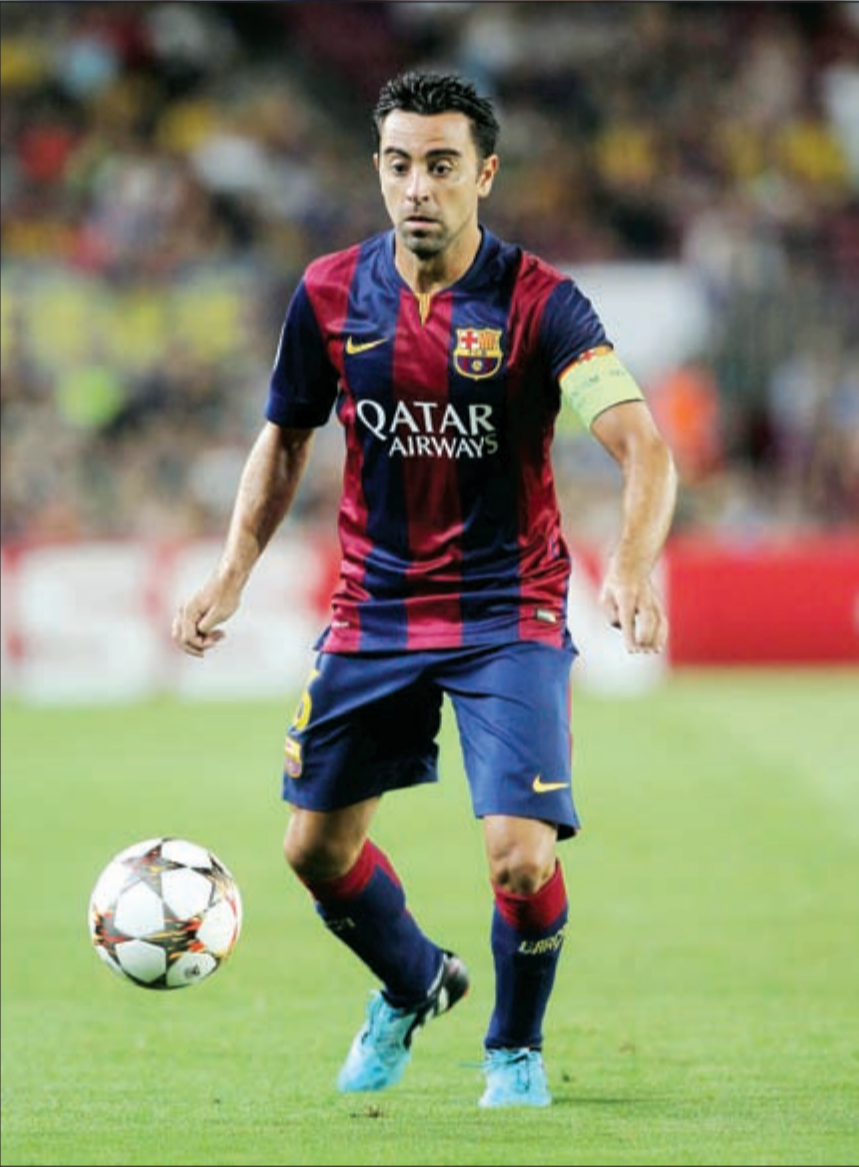
الاسطورة تشافيز من البرشا إلى السد