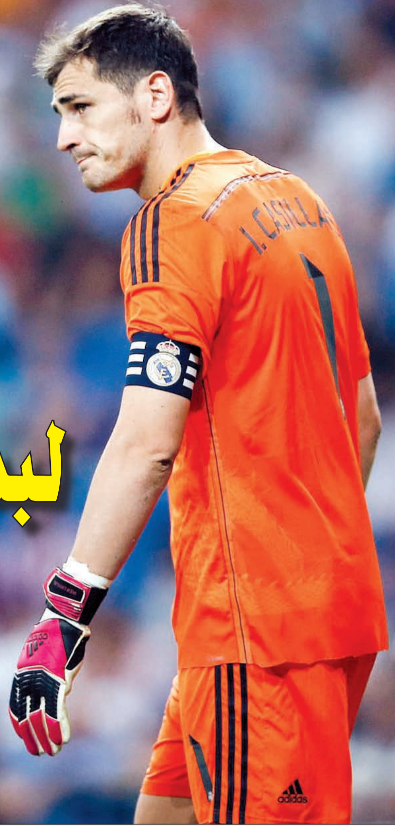
القدس كاسيس «طلق الريال»