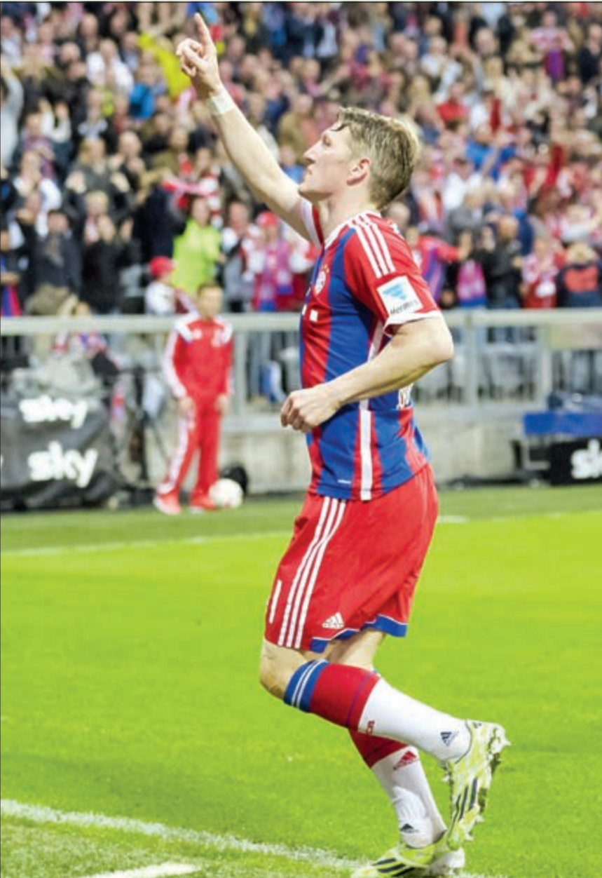
شفاينشتايغر قال وداعا لبايرن