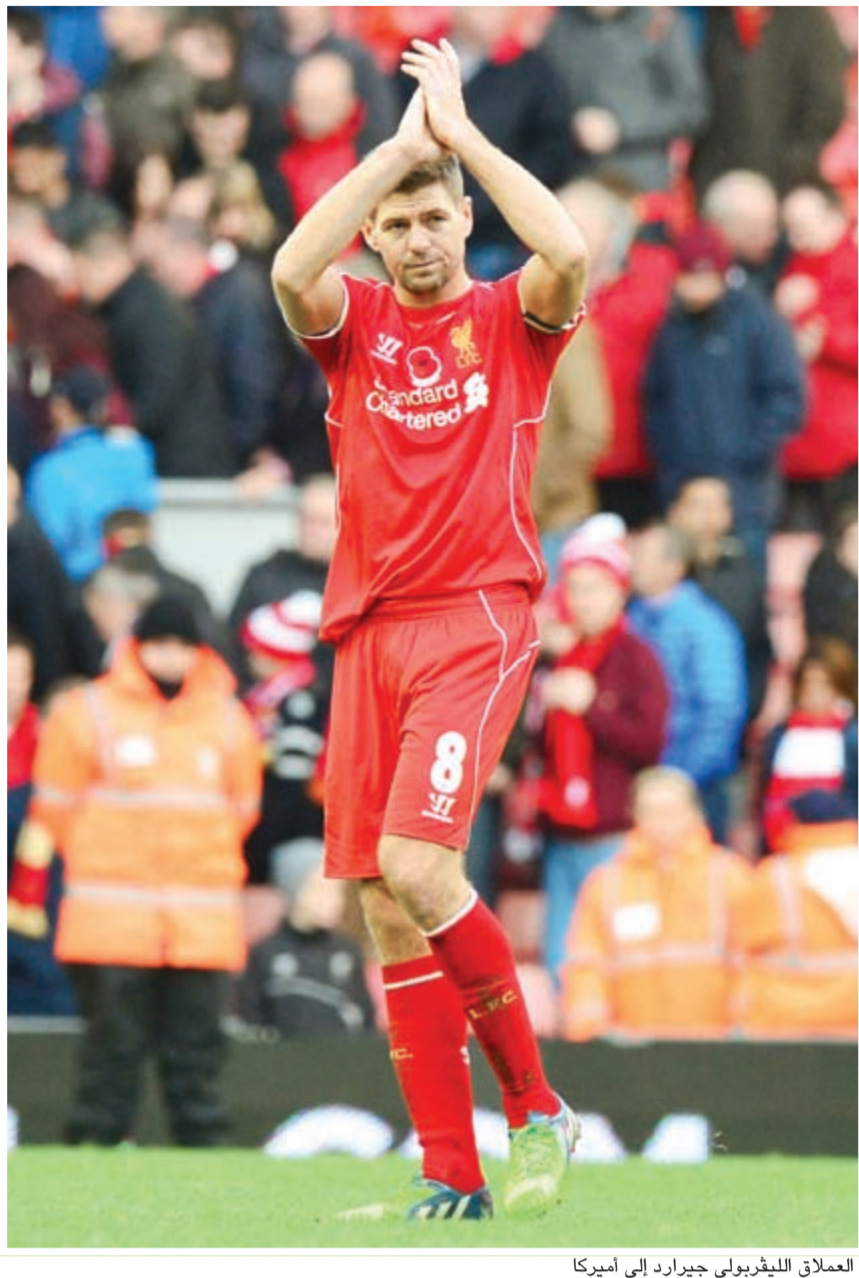
العلاق الليقربولي جيرارد إلى أميركا