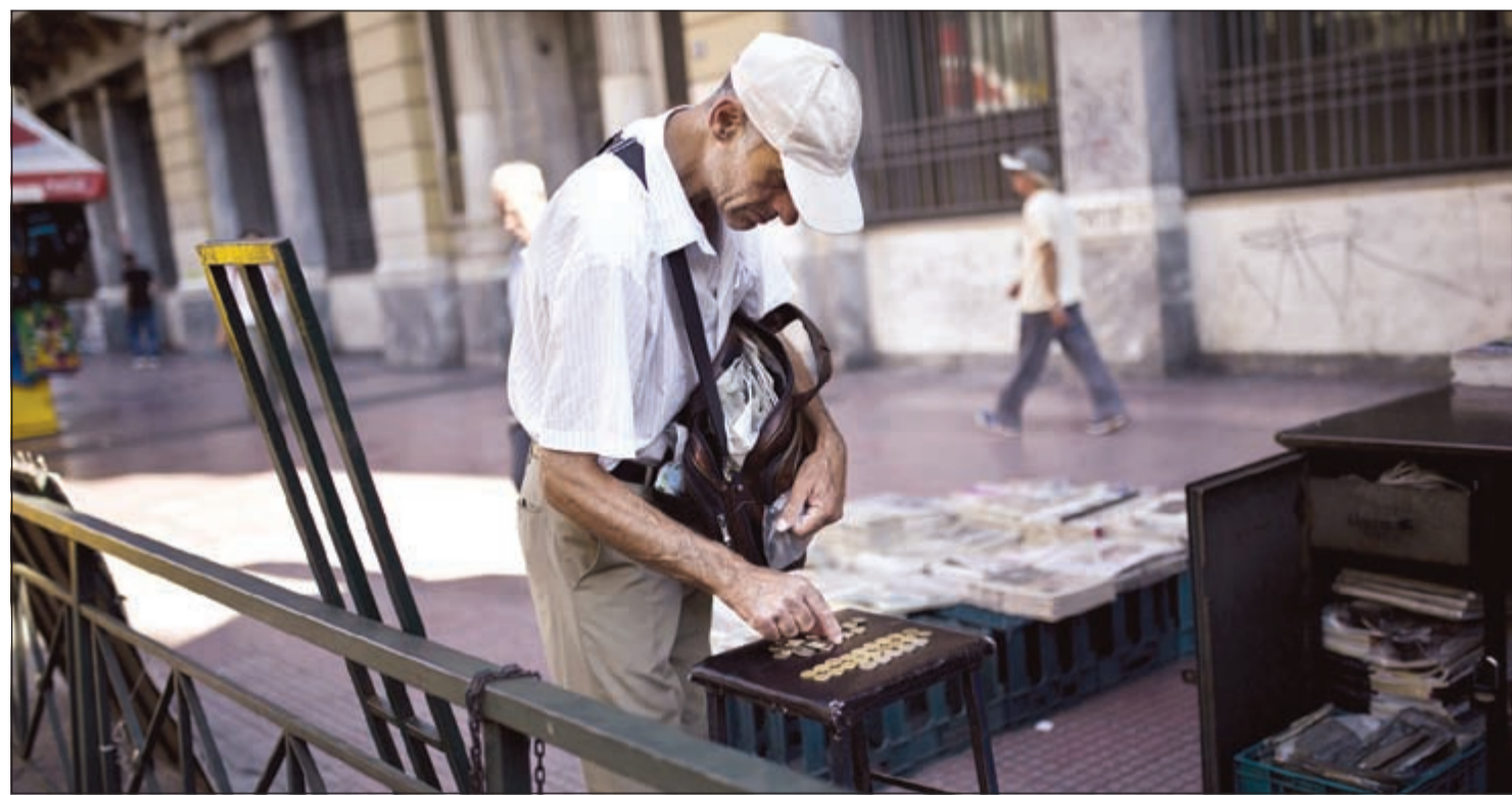
بالع بطاقات الحظ يعد تقوده في اثينا حيث تعتبر اليونان اول دولة متقدمة تفرق في ديون سيادية ولا تتمكن من تسديدها