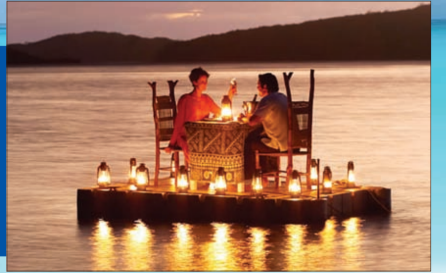
عشاء رومانسي خلال رحلة «شهر العسل» إلى بحر مرمرة وبحيرة سيانجا - تركيا

المالديف وجنوب أوروبا وجهات رومانسية بنفقات منخفضة