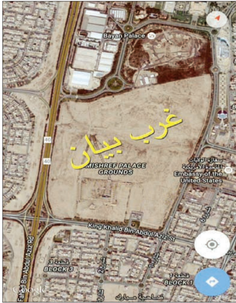
..وأخرى لمنطقة غرب بيان