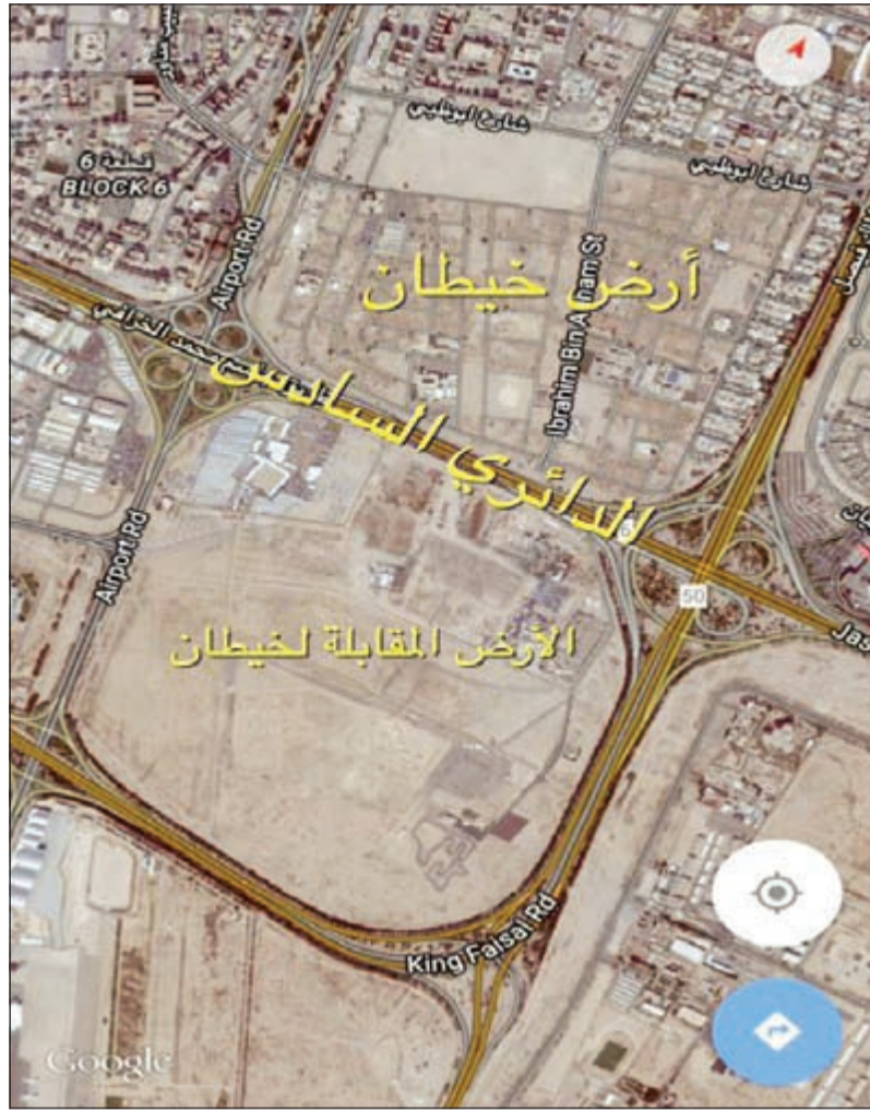
..صورة لمنطقة خيطان ومقابل خيطان