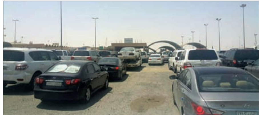
ازدحام شديد في منفذ النويصيب طوال أيام العيد

علمت «الأخبار» من مصدر في ديوان الخدمة المدنية، أن ما يقرب من 30 ألف موظف وموظفة في مختلف وزارات الدولة ومؤسساتها وهيئاتها المدنية، حصلوا على إجازات مرضية بدواعي مراجعة مستشفيات الدولة بنوعيتها الحكومية والخاصة خلال أيام العمل الرسمي التي تلي عيد الفطر المبارك مباشرة، والتي توافق أيام «الغناء والاربعاء والخميس» بدءاً من تاريخ 21 حتى 23 من الشهر الجاري. وأكدت المصادر أنه، بناء على طلب عدد من وكلاء الديوان، سيتم التدقيق في جميع الإجازات الطبية أو المرضية والتحقق من «الصحة» بشكل مباشر حول أسماء الأطباء الذين وقعوا على المستندات اللازمة لأخذ