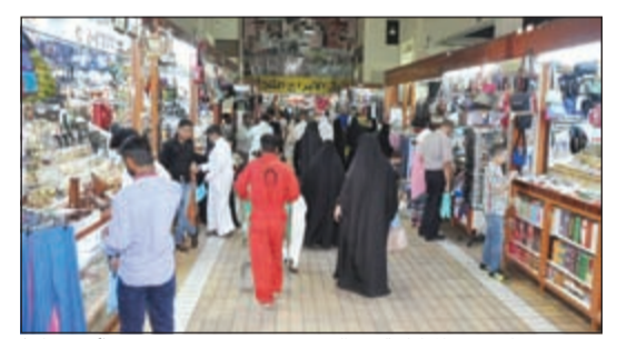
عدد من رواد سوق المباركية في العيد (احمد علي)

7 ملايين دينار صرفها الأهالي على ألعاب الأطفال بالعيد 08