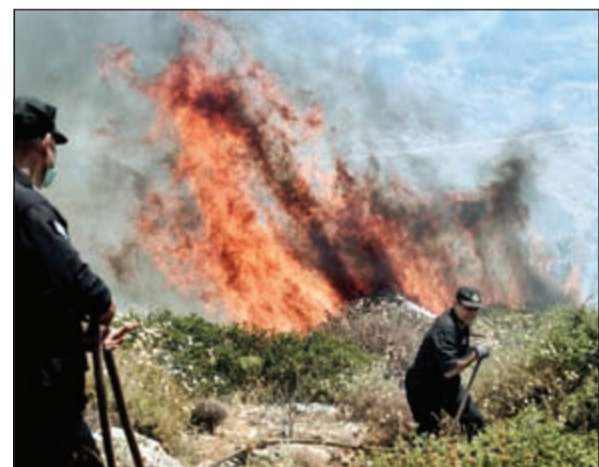
حرائق الغابات في اليونان مرشحة للانتشار

البنوك تفتح اليوم و60 يورو الحد الأقصى للسحب