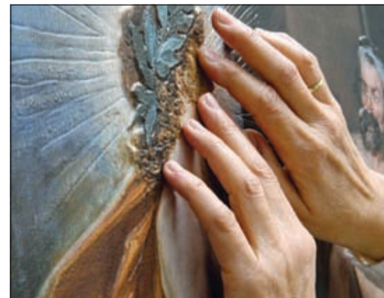
تمت زيادة حجم وسماكة اللوحات من أجل أن يتمكن المكفوفون من لمسها بطريقة تجسدها