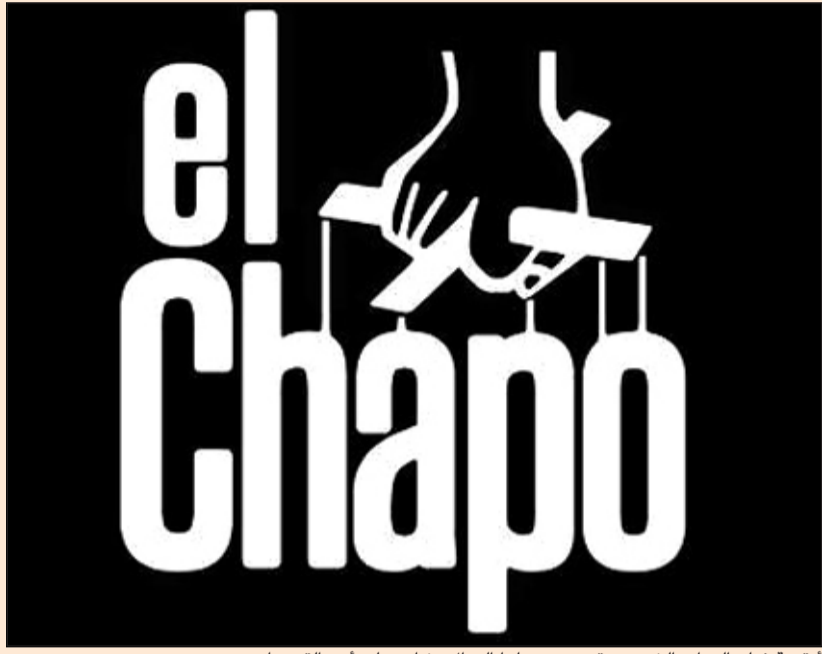
أيقونة فيلم العراب الشهير وقد تم تحويلها إلى إل تشابو على أحد القمصان

ولد خواكيم غوزمان في عائلة متواضعة الأحوال في ولاية سينالوا (شمال غرب المكسيك)، وجمع ثروة كبيرة بحيث أدرج اسمه في قائمة أغنى عشرة أشخاص في العالم التي تعدها مجلة «فوربز» الأمريكية. وسبق لزعيم كارتل سينالوا الذي يقال إن لديه 10 أولاد من عدة نساء أن فر من سجن شديد الحراسة سنة 2001 بعد أن اختبأ في سلة غسيل. وتعززت أسطوره الإجرامية قبل أسبوع إثر فراره الثاني الذي وجه ضربة قاسية إلى حكومة الرئيس المكسيكي إنريكي بينيا نييتو في مساعيها إلى مكافحة الاتجار بالمخدرات.