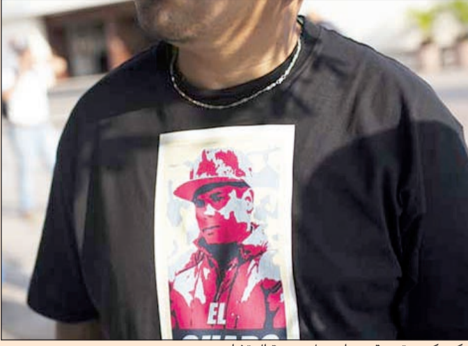
مكسيكي يرتدي قميصاً يحمل صورة إل تشابو

جوهانسبرغ - أ.ف.ب: أعلن مسؤولون في أجهزة الطوارئ ارتفاع حصيلة اصطدام قطارين في جنوب جوهانسبرغ مساء الجمعة إلى أكثر من 200 جريح، فيما تقوم السلطات بالتحقيق في مكان الحادث. وكانت حصيلة سابقة أشارت الجمعة إلى إصابة ما يزيد على 150 شخصا بجروح. ولم يعلن عن خسائر في الأرواح عند اصطدام قطار بآخر كان متوقفاً قرب محطة بويسنز فيما كان العمال عائدين إلى منازلهم من جوهانسبرغ العاصمة الاقتصادية لجنوب أفريقيا. وقال راسل ميرينغ المتحدث باسم أجهزة الطوارئ أي-أر24 التي هرعت إلى مكان الحادث