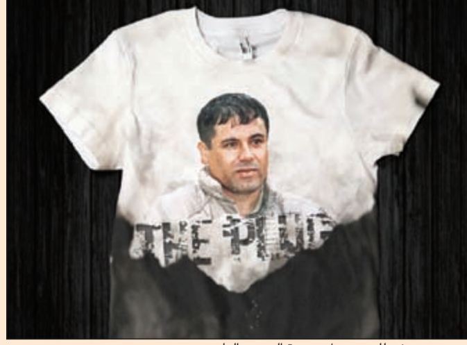
قميص معروض للبيع يحمل صورة السجن الهارب