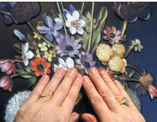
اللوحة أشبه بلوحات ثلاثية الأبعاد