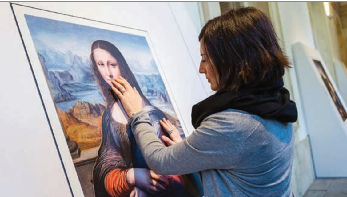
لوحة مجسمة للموناليزا في المتحف