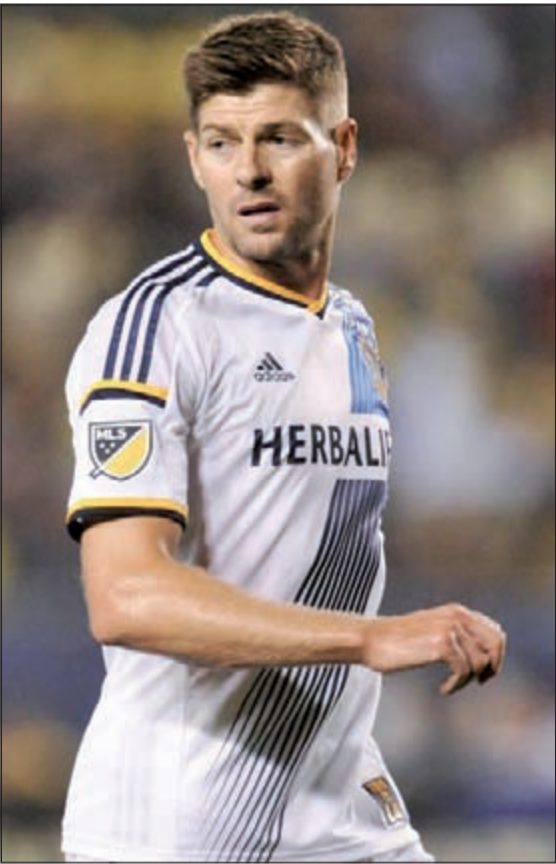
العلاق الإنجليزي.. عطاء مستمر

وأثناء تأخر جالاكسي 2-0 ففز جيرارد في منطقة الجزاء لمقابلة كرة عالية لكن تومي طومسون لاعب سان هوزيه اصطدم برأسه ليحتسب الحكم ركلة جزاء دون تردد وينفذها القائد روبي كين بنجاح ومحرزاً هدفه الأول قبل أن يستكمل الثلاثية في المباراة الثانية على التوالي بالدوري.