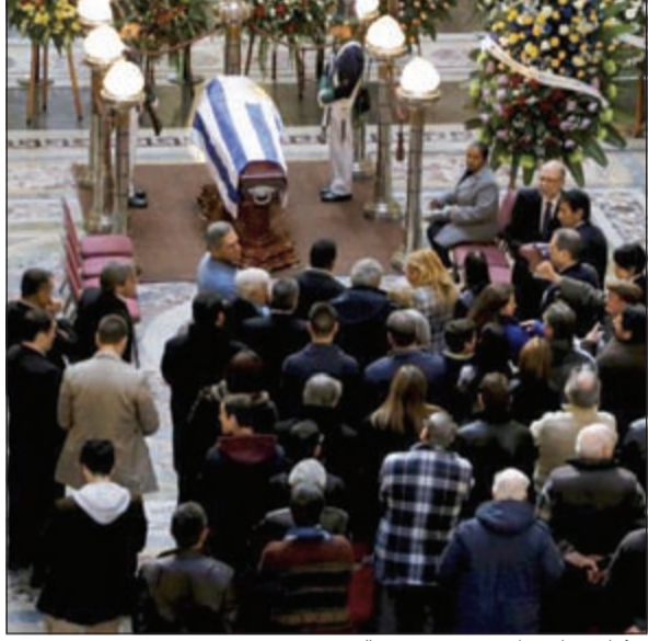
جثمان صاحب أشهر هدف مونديالي

وقال رئيس الاتحاد الدولي لكرة القدم (فيفا) جوزيف بلاتر، عبر حسابه على مواقع التواصل الاجتماعي: «حزين للغاية لوفاة السيديس جييجا، انه بطل حقيقي، تعازي لأسرته وللكرة الأوروغوايانية». بينما جاء على الحساب الرسمي للاتحاد الدولي لكرة القدم (فيفا): «جييجا، صاحب أحد أشهر الأهداف في تاريخ كأس العالم توفي». فيما يرى النجم الأرجنتيني ديبغو مارادونا أن جييجا كان «أحد أساطير كرة القدم العالمية، موضحا أن جييجا أتكى شعب لسنوات طويلة، من جانبه، قال المهاجم الأوروغواياني إدينسون كافاني، لاعب باريس سان جرمان الفرنسي، «رحل أحد