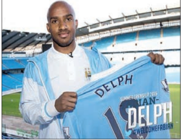
قائد أستون فيلا ينضم إلى سيتي