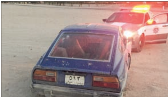
مركبة من بين المركبات المحلة إلى كراج المحز ويبدو من لوحتها انها غير مرخصة