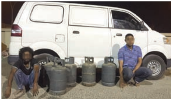
المتهمان وامامهما السلندرات التي تم سرقتها