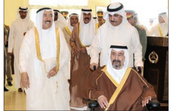
صاحب السمو الأمير وسمو ولي العهد وسمو الشيخ سالم العلي في نادي ضباط الحرس الوطني