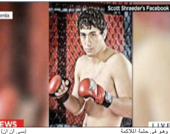
.. وهو في حلبة الملاكمة

من هو الإرهابي محمد يوسف عبدالعزيز؟ ● حمل الجنسية الأردنية وحصل على «الأميركية» مع بقية أفراد أسرته عام 2009. ● ولد بالكويت في سبتمبر 1990، وزارها في 31 مايو 2010. ● درس الهندسة الكهربائية في أميركا وأجاد المصارعة الحرة. ● كتب في سجل تخرجه السنوي «اسمي يثير قلق أجهزة الأمن. ماذا عن اسمك انت؟». ● اعتقلته شرطة المرور في الولايات المتحدة قبل أشهر لتعاطيه مخدرا أثناء قيادة السيارة.