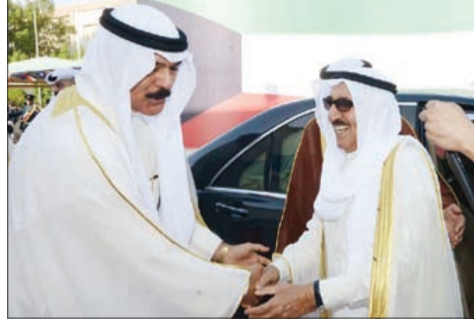
سمو الأمير مصافحا الشيخ محمد الخالد في بداية زيارة سموه لنادي ضباط الشرطة