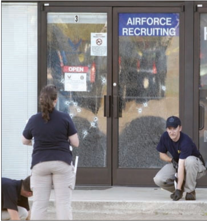
عناصر مكتب التحقيقات الفيدرالي الأمريكي يرفعون الآثار بموقع الهجوم الإرهابي اسس (دويتزن)

من هو الإرهابي محمد يوسف عبدالعزيز؟ ● حمل الجنسية الأردنية وحصل على «الأميركية» مع بقية أفراد أسرته عام 2009. ● ولد بالكويت في سبتمبر 1990، وزارها في 31 مايو 2010. ● درس الهندسة الكهربائية في أميركا وأجاد المصارعة الحرة. ● كتب في سجل تخرجه السنوي «اسمي يثير قلق أجهزة الأمن. ماذا عن اسمك انت؟». ● اعتقلته شرطة المرور في الولايات المتحدة قبل أشهر لتعاطيه مخدرا أثناء قيادة السيارة.