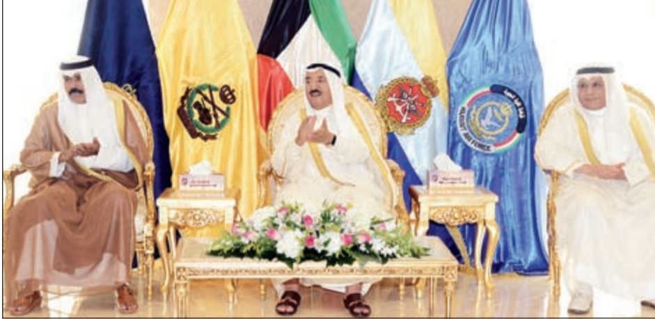
صاحب السمو الأمير وسمو ولي العهد الشيخ خالد الجراح خلال زيارة لواء مبارك المدرع الخامس عشر