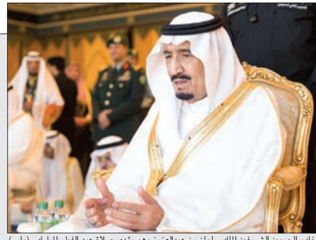
خادم الحرمين الشريفين الملك سلمان بن عبدالعزيز وهو يؤدي صلاة عيد الفطر المبارك

خادم الحرمين الشريفين: أمتنا بأمن الحاجة للمسك بمبادئها لتقف في وجه التطرف والإرهاب 26