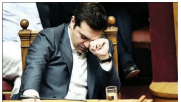
رئيس الوزراء اليوناني خلال جلسة البرلمان في أثينا (أ.ف.ب)

الحكومات الأوروبية منقسمة حول الخيارات الممكنة لمساعدة اليونان على تلبية احتياجاتها إلى السيولة على المدى القريب في انتظار إقرار خطة جديدة بين وزراء منطقة اليورو، غير أنه ترك حكومة اليسار الراديكالي في موقع ضعيف. ونجح رئيس الوزراء اليوناني الكسيس تسيبراس ليل أمس الأول في تمرير أول الإصلاحات التي يطالب بها الدائنين لمنح البلاد خطة مساعدات جديدة، غير أنه احتج إلى أصوات المعارضة للحصول على عدد النواب الضروري من أجل إقرارها. وجرى التصويت في البرلمان فيما كانت شوارع أثينا تشهد تظاهرات غاضبة احتجاجاً على سياسة التقشف التي خلالها المتظاهرون زججوا حارقة على الشرطة. وصادق البرلمان على الإجراءات المطروحة والمتعلقة بصورة خاصة بزيادة ضريبة القيمة المضافة وإصلاح نظام التقاعد وتبني تدابير من أجل تحقيق التوازن في الميزانية، حيث صوتت 229 صوتاً فيما صوتت 64 نائباً ضدها وامتنع 6 عن التصويت. وفي هذه الأثناء، لا تزال