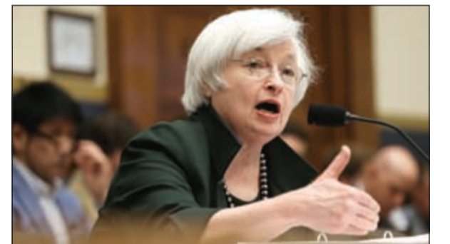
جانيت يلين تدلي بشهادتها النصف السنوية في الكونغرس

واشنطن - رويترز: قاومت رئيسة مجلس الاحتياطي الاتحادي جانيت يلين دعوات إلى تقدير أكبر من الإشراف للكونغرس على البنك المركزي الأمريكي مع تزايد انتقادات أعضاء لجنة الخدمات المالية في مجلس النواب لسياسات البنك وحثه على أن يكون عرضة لمزيد من المساءلة. وفي شهادتها نصف السنوية في الكونغرس أمس الأول، قالت يلين مجدداً إن من المرجح أن يرفع المركزي الأمريكي أسعار الفائدة في وقت لاحق هذا العام إذا حقق الاقتصاد النمو المتوقع، مشيرة إلى تحسن سوق العمل. وجاءت تعليقاتها متفقة إلى حد كبير مع بيان لجنة صنع السياسة النقدية بمجلس الاحتياطي الشهر الماضي. لكن في جلسة الاستماع بلجنة الخدمات المالية تراجعت السياسة النقدية لتتطو على السطح مسألة شفافية البنك المركزي. وقالت يلين: «نقول إننا نخطط لإعطاء الوثائق لكم بمجرد أن يكون بمقدورنا أن نعلق ذلك دون تقويض مصداقية تحقيق جنائي مفتوح. وأضاف أن المركزي الأمريكي لديه قواعد واضحة يتبعها في حال حدوث تسرب لمعلومات مزعومة.