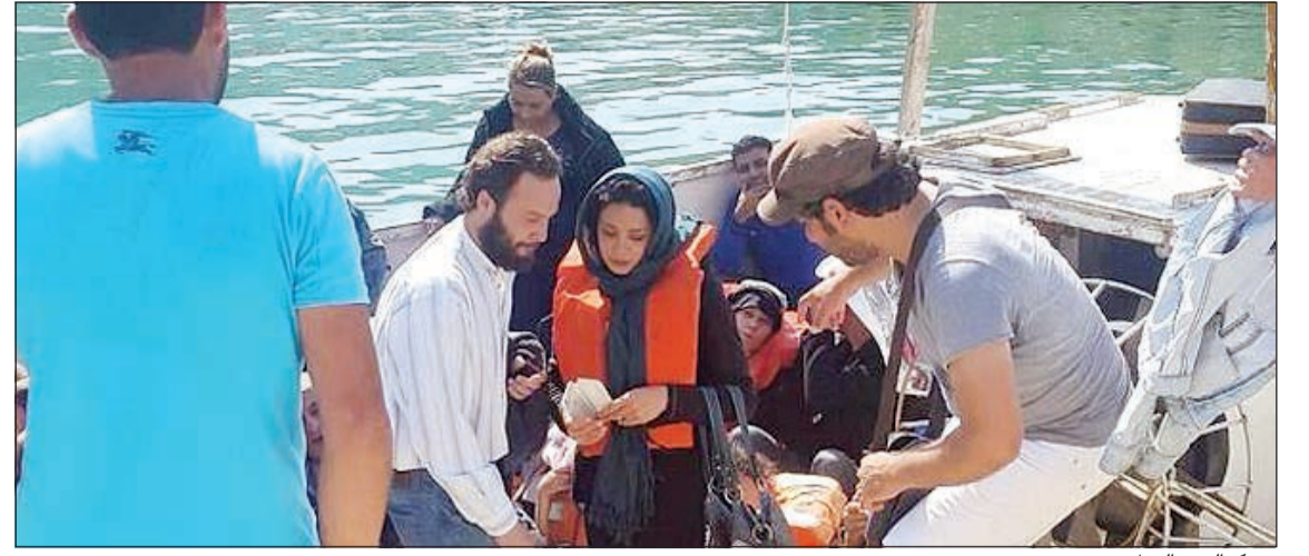
من كواليس العمل