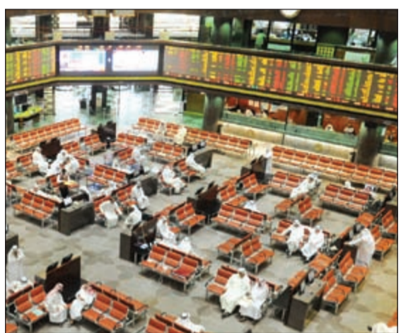
السوق ينتعش قبل نهاية رمضان

البورصة الكويتية، وذلك على الرغم من اقتراب شهر رمضان من نهايته، وهي عادة فترة تشهد ركوداً وانخفاضاً في مستوى السيولة جراء عزوف عن الشراء للاحتفاظ بالسيولة قبل العطلة. واستهدفت المحافظ والصناديق الاستثمارية إلى جانب الأفراد الأسهم التشغيلية في جلسة أمس، حيث استحوذت أسهم مؤشر كويت 15 على 9 ملايين دينار تشكل نحو 51٪ من السيولة. خليجياً، واصلت أسواق الأسهم الخليجية نشاطها الإيجابي على وقع النتائج المالية التي يتم الإعلان عنها هذه الأيام، فضلاً عن توصل إيران والقوى الكبرى في العالم لاتفاق نووي، وخالفت الأسواق المخاوف بشأن مستقبل أسعار النفط في ظل