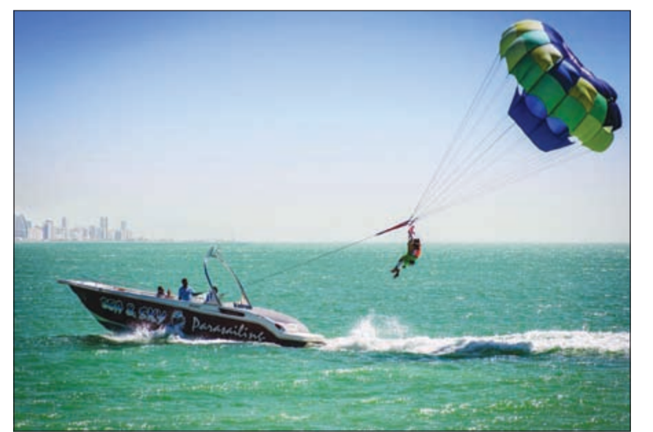
إطلالة بحرية فريدة

أعلن فندق ومنتجع جميرا شاطئ المسيلة، الوجهة الفندقية الأكثر فخامة في الكويت، أن ضيوفه من العائلات والأصدقاء على موعد مع قضاء عطلة ممتعة خلال الاحتفال بعيد الفطر المبارك.