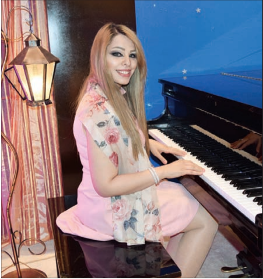
أجواء رمضانية استثنائية