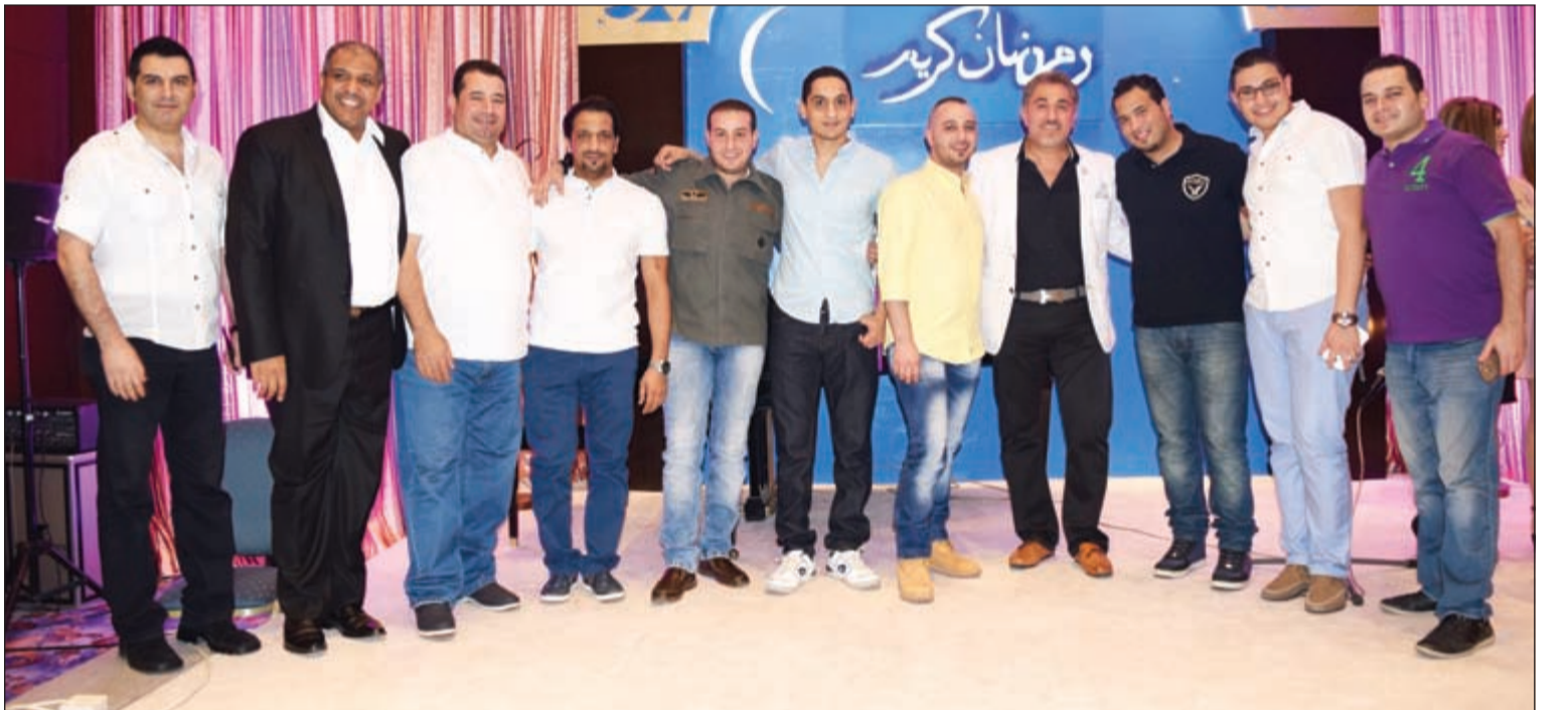
ترجمان مع عدد من الحضور