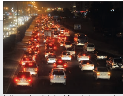
ازحام مروري على إحدى الطرق قبيل العيد (محمد هاشم)