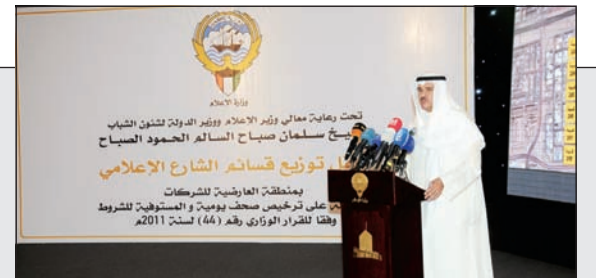
وزير الإعلام ووزير الدولة لشؤون الشباب الشيخ سلمان الحمود متحدثاً للحضور خلال توزيع قسائم الشارع الإعلامي

وزير الإعلام خلال توزيع قسائم الشارع الإعلامي بالعرضية: القيادة السياسية العليا لا تدخر وسعاً ولا جهداً في دعم ورعاية المؤسسات الإعلامية الخاصة المقروءة والمربنية والمسموعة 14