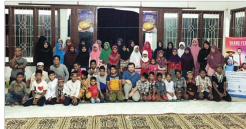
جانب من حملة «التركية» لتوزيع وجبات الإفطار