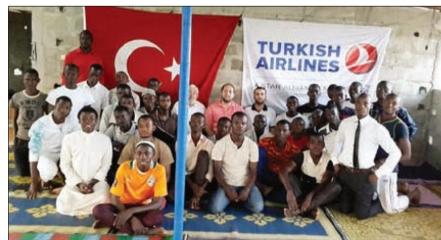
الخطوط الجوية التركية توزع وجبات الإفطار على المحتاجين

وتواصل الخطوط الجوية التركية، الحائزة جائزة «أفضل ناقل في أوروبا» للعام الخامس على التوالي ضمن «جوائز سكاى تراكس 2015»، إثارة إعجاب المسافرين من خلال خدماتها الحائزة للعديد من الجوائز وشبكته المتميزة من البلدان مقارنة بأي ناقلة أخرى.