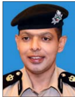
العميد عادل الحشاش

كما أشار العميد الحشاش إلى أن المكاتب الوهمية تلجأ إلى استغلال هؤلاء الخدم الهاربين في أعمال مخلة بالأداب العامة مقابل التستر عليهم وإجبارهم على القيام بأعمال شاقة وحجز حريتهم