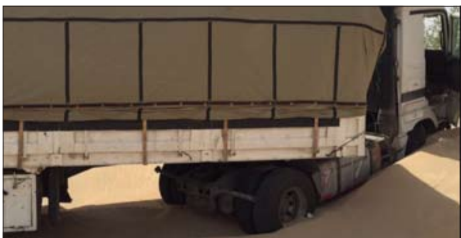
الشاحنة بعد أن غرقت في الكثبان الرملية

وعليه توجه رجال الإسعاف والنجدة إلى موقع البلاغ وتمت معالجة السائق في موقع الحادث بعد أن رفض الانتقال إلى المستشفى، خاصة أن إصاباته رضوخ في الجسم ولا توجد أي إصابات خطيرة، وسجلت قضية.