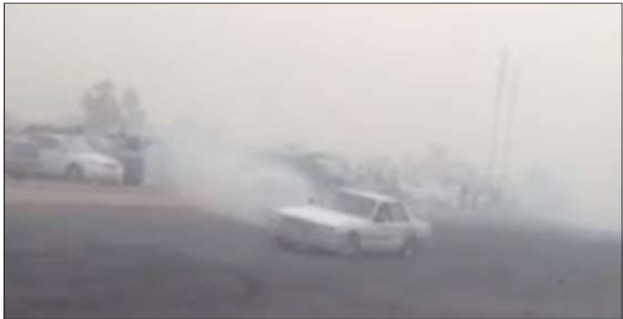
جانب من استعراض لمستهترين في الجهراء مساء أول من أمس

مصدر أمني ان المشكلة تكمن في طريقة عمل خطة الانتشار الأمني التي يطبقها مسؤولو الأمن في الجهراء والتي ينقصها الكثير من نواحي تغطية المناطق الرئيسية ويكتفي فقط بنقاط التفقيش الثابتة على مداخل المنطقة دون عمل دوريات مستمرة في المناطق الداخلية وتوجيه دوريات إلى أماكن المستهترين، مضافا انه وخلال الأيام القليلة المقبلة سيتم تغيير الخطة الأمنية لتتلاءم مع متطلبات وطبيعة المنطقة.