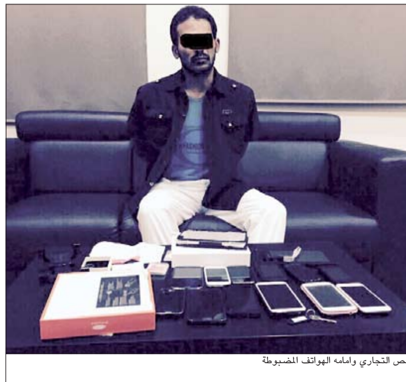
الص التجاري وامامه الهواتف المضبوطة

قام رجال الإسعاف بتقديم العلاج لسائق شاحنة بعد أن اصطدم بكثبان رملية على طريق السالمي. وقال مصدر أمني ان بلاغا ورد إلى غرفة عمليات الداخلية عصر امس الاول عن حادث اصطدام شاحنة عملاقة بنجم لكثبان الرملية على طريق السالمي السريع واصابة سائقها،