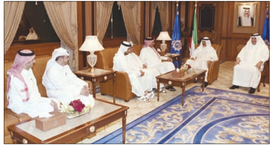
الشيخ محمد الخالد مستقبلاً رؤساء الوفود المتخصصة لأجهزة الأمن السياسي الخليجية

من جانب آخر، أعرب الشيخ الخالد عن فخر واعتزاز كل منتسبي وزارة الداخلية قادة وضباط وافراداً للثناء والتقدير الذي وجهه صاحب السمو الأمير الشيخ صباح الأحمد في كلمته بمناسبة العشر الأواخر من شهر رمضان الفضيل وخص أبناءه رجال الأمن بالإشادة لسرعة التوصل إلى مرتكبي جريمة التفجير الإرهابي البشعة بمسجد الإمام الصادق، مؤكداً لسموه وقوف جميع رجال وأجهزة الأمن خلف قيادته الحكيمة صفواً واحداً ضد الإرهاب والمجرمين والوقوف بكل قوة في مواجهة كل من يضمن الشرر وتسول له نفسه العبث بأمن الوطن وسلامة المواطنين.