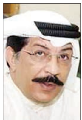
اللواء عبدالحميد العوضي

من خلال البحث والتحري تم رصد مصنع خاص بصناعة الاحبار المقلدة، وداهمت الفرقة المعنية بمكافحة العمال وصاحب المصنع، وأحيلوا إلى التحقيق.