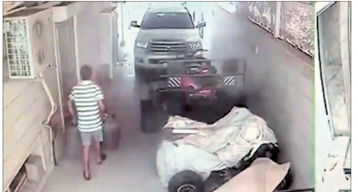
لقطة فيديو ترصد قيام أحد المتهمين بسرقة سلندرات غاز من منزل في منطقة السرة

تمكن أطباء مستشفى الجواهر من استخراج عدد من الرصاصات الصغيرة من ظهر آسيوي بعد أن أدخل إلى المستشفى إثر تعرضه لإطلاق نار من بندقية صيد (شوون)، وقال مصدر أممي إن الآسيوي تم إدخاله المستشفى على