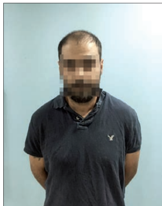
.. وشريكه المواطن