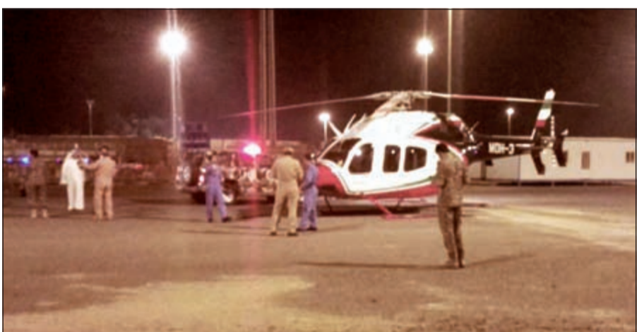
الطيران العمودي اثناء نقل المصاب إلى مستشفى العدان

وقال مصدر اممي إن بلاغا ورد من رجال جمارك النوصيب أفادوا بوجود شخص يعاني من حالة صحية حرجة بعد أن سقط دون حراك، هذا، وتم استدعاء الطيران العمودي الذي قام بنقله إلى مستشفى العدان ليدخل العناية الفائقة على الفور، ووصفت حالته بالمستقرة.