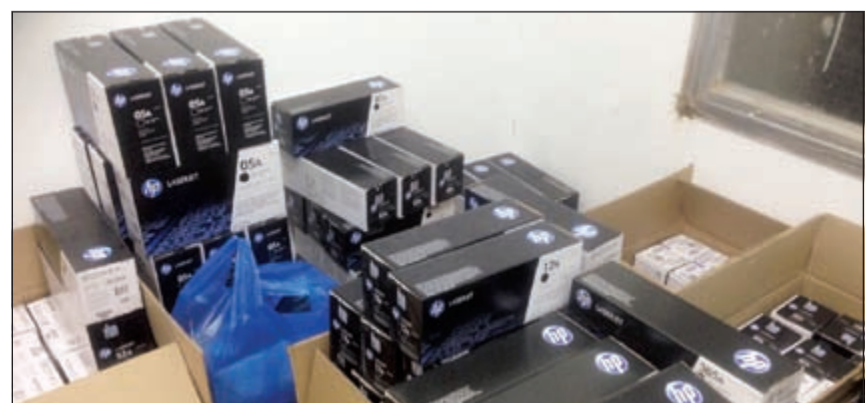
«أخبار المقلدة» المضبوطة