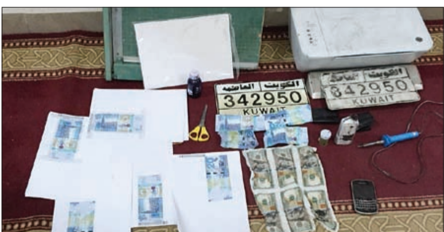
مجموعة من العملات المزيفة ضبطت بجوزة المتهمين

على 280 ديناراً مزورة، وتم تسجيل قضية في مخفر الفيروان وتحويلها الى الإدارة العامة للمباحث الجنائية لطلب التحريات، وقد اعترفا بانهما يقومان بتزوير النقود الكويتية من فئة 20 ديناراً، وأن منزل «ع.أ» به ماكينة تصوير واموال مزورة معدة للترويج، وبعد اتخاذ الإجراء القانوني اللازم تم تفتيش المنزل، حيث عثر على ماكينة التصوير ونقود من فئة الـ 20 ديناراً مزيفة للترويج. هذا وتمت إحالتهما والمضبوطات الى جهة الاختصاص.