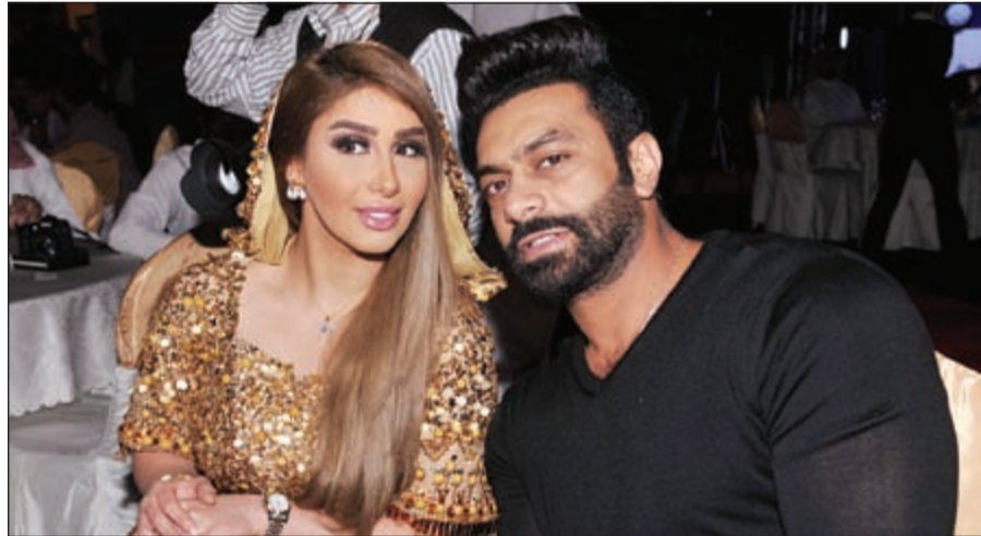
أفضل ممثلة دور أول هنادي الكندري مع زوجها