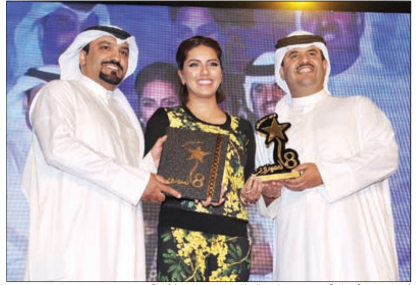
أفضل مخرجة درامية في 2015 هيا عبدالسلام عن «في عينها أغنية»