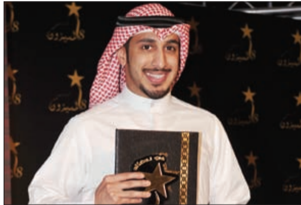
أفضل ممثل كوميدي .. فهد البناي