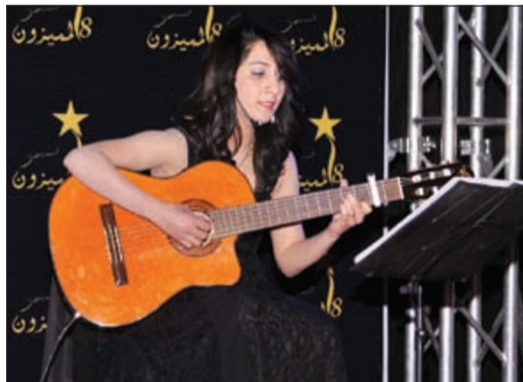
الفنانة إيما شاه أمتعت الحضور بأجمل الأغنيات