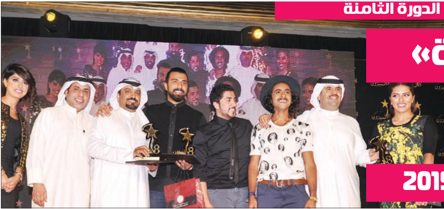
فريق «في عينيها أغنية».. أفضل مسلسل في الدورة الثامنة لمهرجان المميزون في رمضان (قاسم باشا)