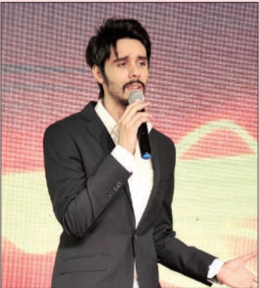
نجم «ستار أكاديمي» فهد الزايد

بعد تكريمها كضيفة شرف للمهرجان هذا العام، عبرت النجمة المصرية سميرة الخشاب عن سعادتها بالتواجد في الكويت وتكريمها بعد نجاح مسلسلها الرمضاني «يا أنا يا أنتي»، وقالت: الكويت حبيبة إلى قلبي وأتقدم بالتعازي لأسرة شهداء الحادث الاليم الذي وقع فيها الفترة القليلة الماضية وأعزى أيضاً شهداء مصر وتونس، وأدعو الله أن يحمي شعوبنا وحكامنا من كل مكروه، ومن الكويت لا للإرهاب.