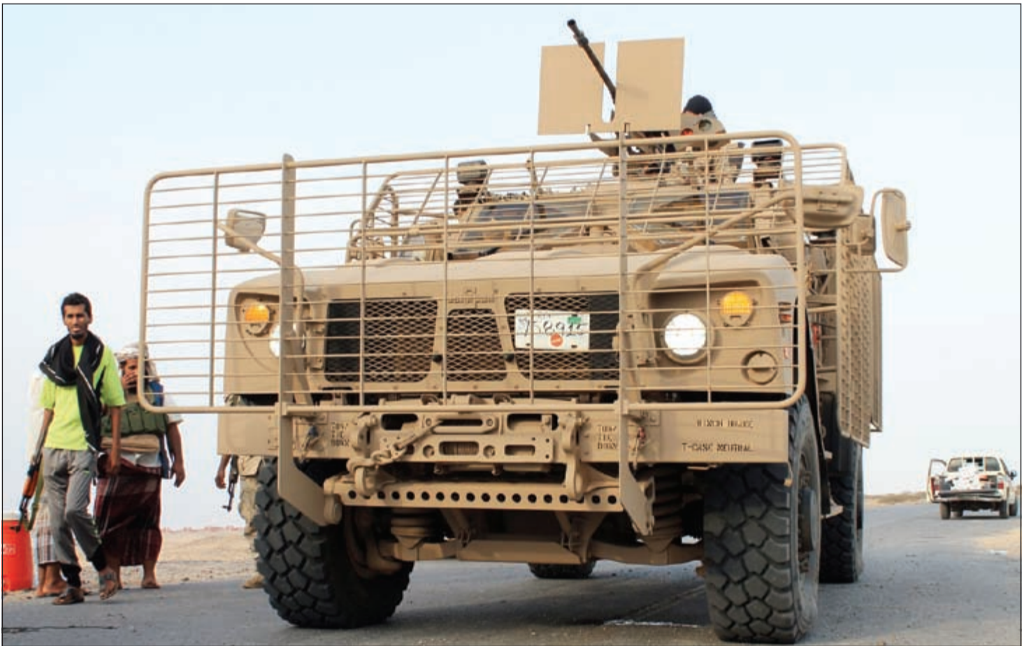
عناصر من المقاومة الشعبية وقوات الجيش المؤيدة للرئيس اليمني عبدربه منصور هادي في عدن امس الاول

عدن - وكالات: حملت الحكومة الشرعية في اليمن المتمردين الحوثيين مسؤولية خرق الهدنة الإنسانية، والتي كانت يمكن أن تخفف من معاناة المواطنين في مناطق الاشتباكات.