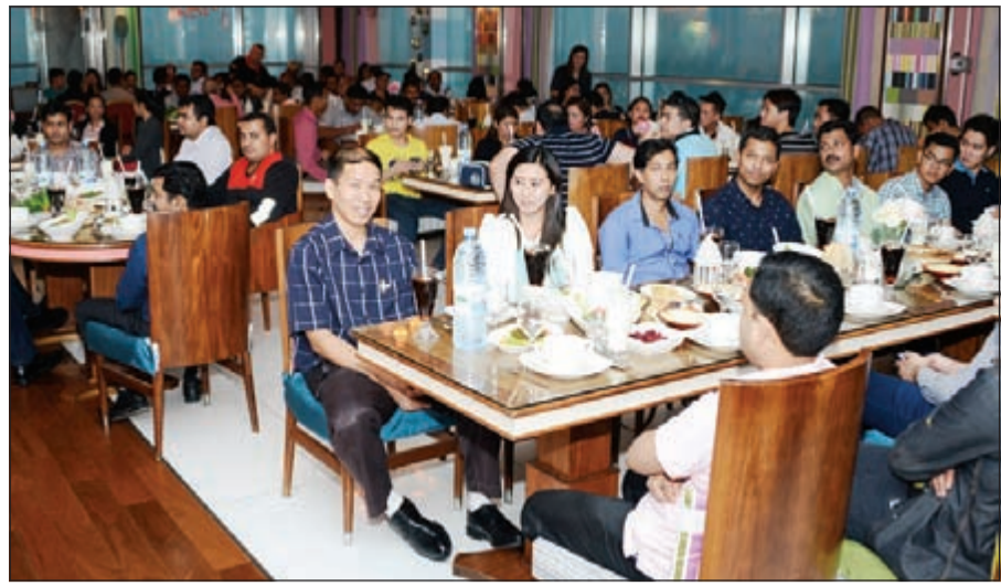
جانب من إفطار مجموعة الكوت في برج الحمام