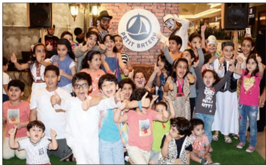
فرحة الأطفال بالقرقيعان

يمكن الاحتفال وتخلل الحفل بعض النشاطات المرحة والمسلية في أجواء احتفالية كرنفالية أضفت السعادة والسرور على المشاركين. واستمتع الأطفال والآباء بالأجواء الاحتفالية والفقرات التي قام بتقديمها المذيع المتميز سعود بالإضافة إلى مهرج القرن 17 الفرنسي الشهير بيير، كما قدمت لهم هدايا وحلويات القرقيعان من وحي المناسبة لكي تزيد من فرحتهم بهذه المناسبة، وتستقبل Petit Bateau في فرعها الكائن في الأقيانوس خلال جميع أيام الأسبوع.