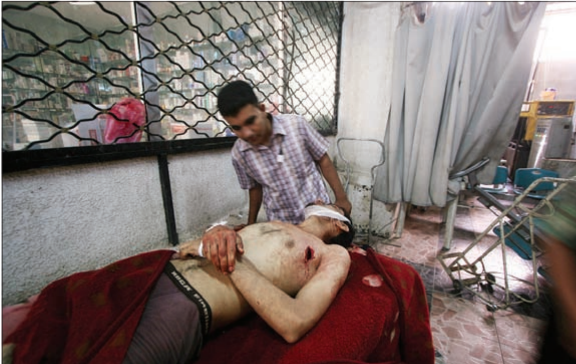
جريح من المقاومة الشعبية الموالية للرئيس عبد ربه منصور هادي خلال تلقيه العلاج في أحد مستشفيات تعز أمس الأول

وشاركت في مواجهات عنيفة مع المتمردين الحوثيين وقوات صالح في الجبهة الشمالية الشرقية لتعز، وحررت عدة مناطق واستولت على عتاد عسكري. وفي عدن واصل المتمردون قصف الأحياء السكنية في دار سعد والمنصورة والشيخ عثمان شمال المدينة ومديرية البريقة شمال غرب عدن بقذائف الهاون والكتاوشا حيث سقط عشرات الجرحى من المدنيين بينهم نساء، فيما قتل وجرح عدد من المدنيين بينهم طفل في عمليات قصف نفذتها مليشيات الحوثي بعدن.