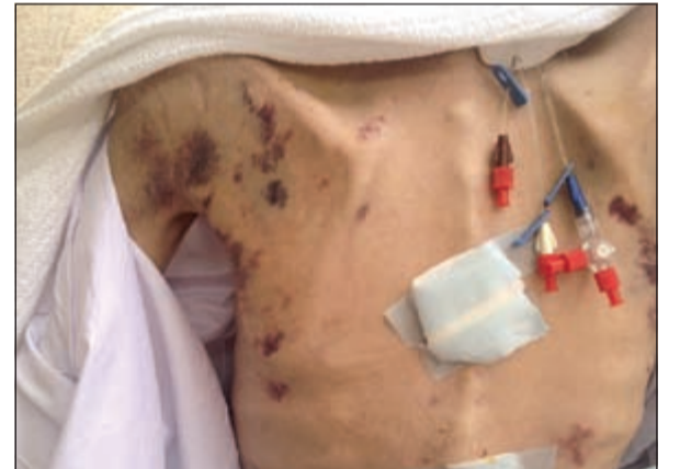
نتوء عظام وتقرحات وكدمات