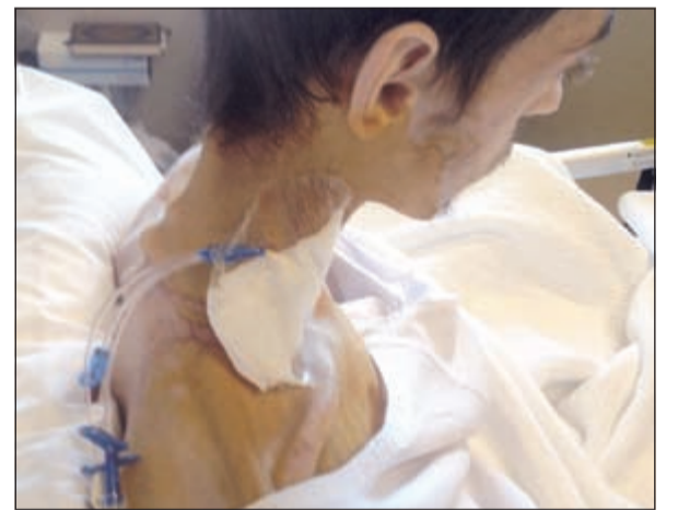
الطب لم يتوصل بعد لحالته