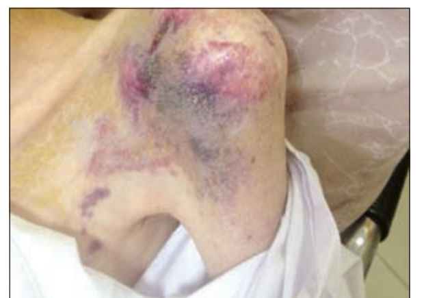
حالة ليست عادية