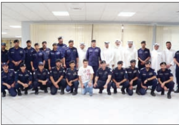
صورة جماعية لفريقي بنك الكويت الوطني وخفر السواحل

كما تلتزم عائلة البنك الوطني بتنظيم النشاطات والزيارات المتواصلة لهذه القطاعات في إطار اهتمام البنك بالفعاليات الاجتماعية والإنسانية، وتعبيرا عن روح المشاركة والتواصل مع جميع شرائح المجتمع. وأضاف التركي: «الوطني» يحرص بصورة مستمرة على تنظيم النشاطات والمبادرات الاجتماعية في العديد من المجالات وقد انطلقت هذه