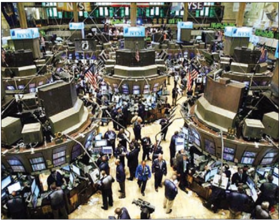
توقف التداولات في بورصة «نيويورك» يعيد تكريات سيئة عن توقف البورصات العالمية