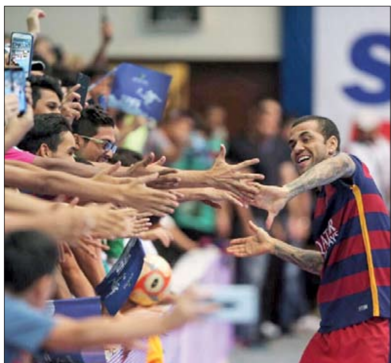
مصافحة الجماهير بعد تسجيل الهدف