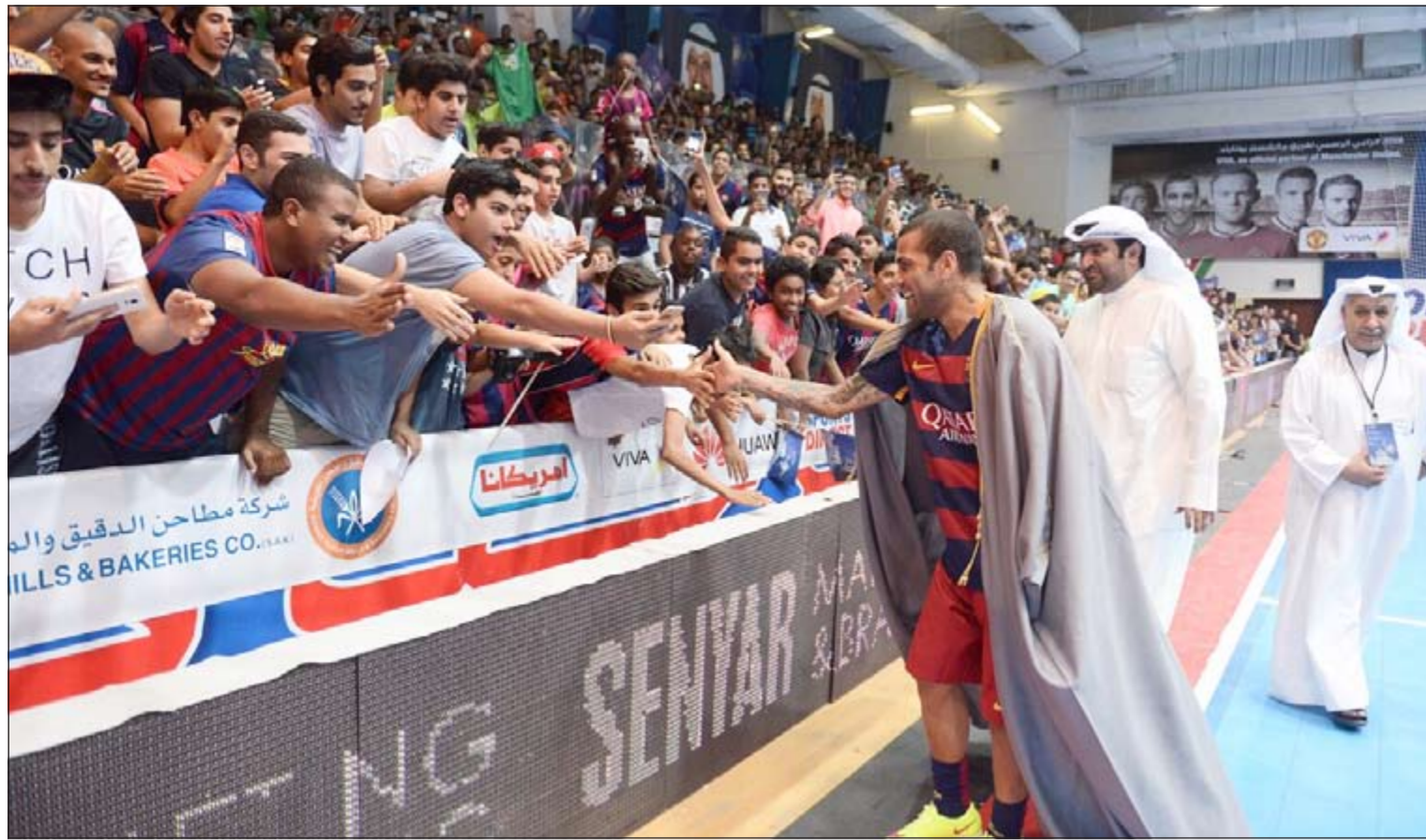
الفيس مرتديا البشت وهو يصافح الجمهور