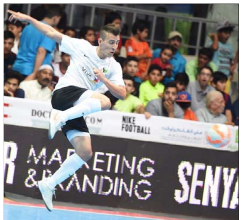
تسديدة قوية على الرمي