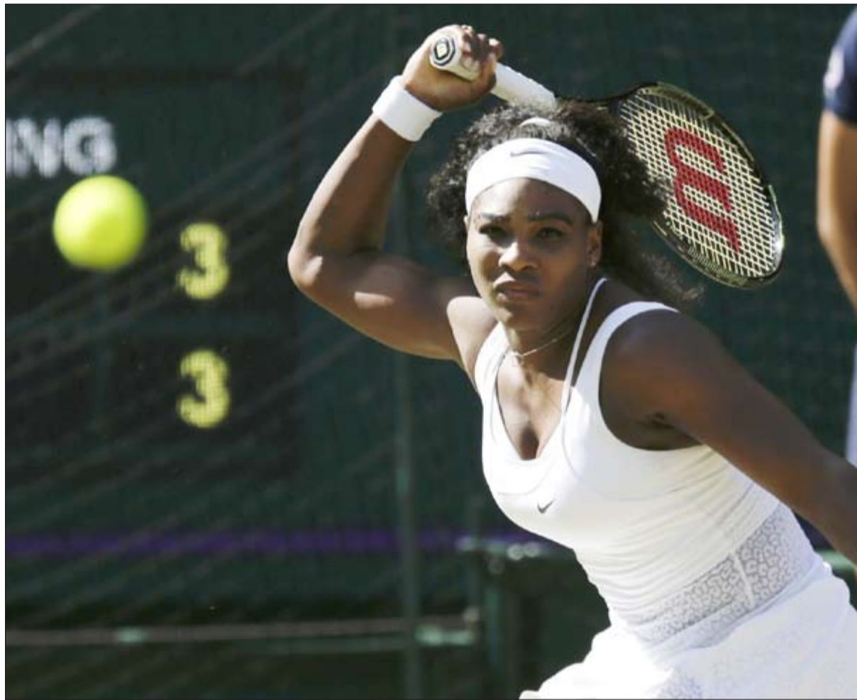
سيرينا وليامز المصنفة أولى