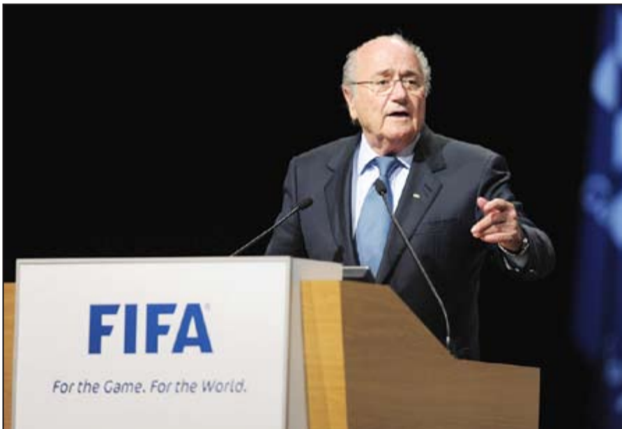
رئيس «فيفا» السويسري جوزيف بلاتر

وتابع «لكنني اطالب بالعدالة والانصاف، لا أتحمل أي مسؤولية عن تصرفات اعضاء