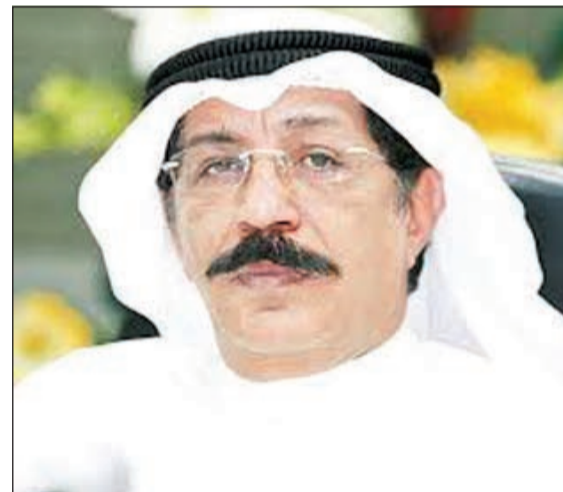
اللواء عبدالحميد العوضي

توقيف المواطن، ومضى المصدر بالقول: تم الإيعاز الى العقيد محمد قبازرد والذي بدوره أجرى المزيد من التحريات والتي أكدت صحة المعلومات التي وردت الى اللواء العوضي ونقلت الى العقيد الدرعي، وعليه شرع العقيد قبازرد الى ضبط المواطن في وضعية