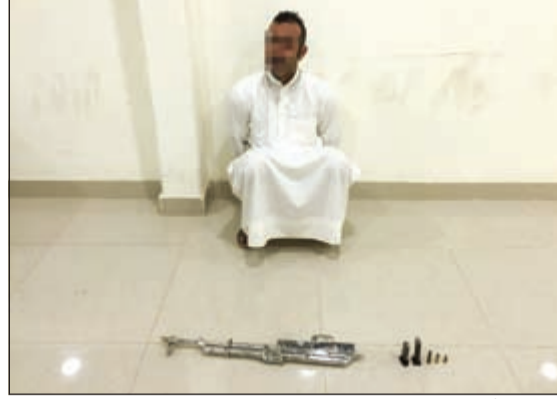
البدون وأمامه الكلاشينكوف