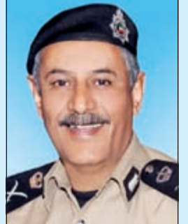
اللواء زهير النصرالله

بالقرب من أحد المساجد في منطقة الفروانية وقبل صلاة التراويح تم الاشتباه في إحدى المركبات وعند التأكد من