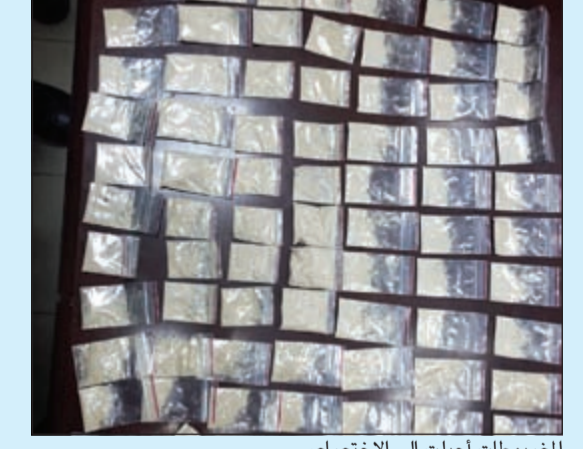
المضبوطات أحيلت إلى الاختصاص

احتراريا وعثر بحوزتهما على المواد المخدرة وحبوب المؤثرات العقلية المذكورة، وتم إحالتها والمضبوطات إلى جهة الاختصاص. واكد اللواء زهير النصرالله، أن الإدارة العامة لشرطة النجدة تعمل على مدار الساعة في نطاق كل محافظات الكويت لحفظ الأمن والأمان ومتابعة كل الظواهر السلبية والتعامل معها بكل جدية وحزم، بالإضافة إلى تلقي أي بلاغات والتجاوب معها بالسرعة اللازمة في إطار خطة أمنية شاملة تحقيقا للأمن والاستقرار في المجتمع.