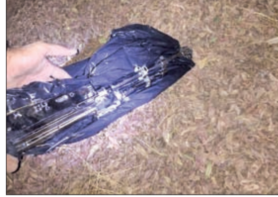
السلاح عقب استخراجه من الساحة الترابية