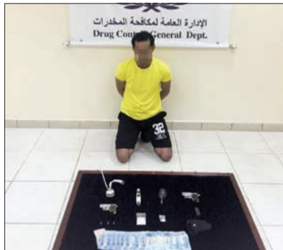
الموظف في الدفاع وأمامه المضبوطات